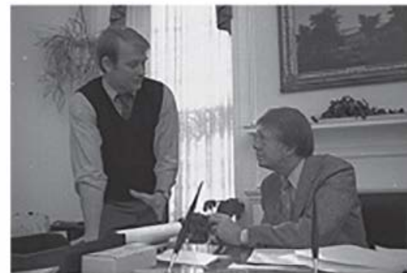
Рис. 2.1. Президент США Джиммі Картер (Jimmy Carter) і його прес-секретар Джоді Пауел (Jody Powell), 10 лютого 1977 року

називати певну людину брехуном, якщо вона вам неприємна, але важко вжити це слово стосовно людини, яка, незважаючи на свою явну брехливість, подобається вам чи викликає у вас захоплення.