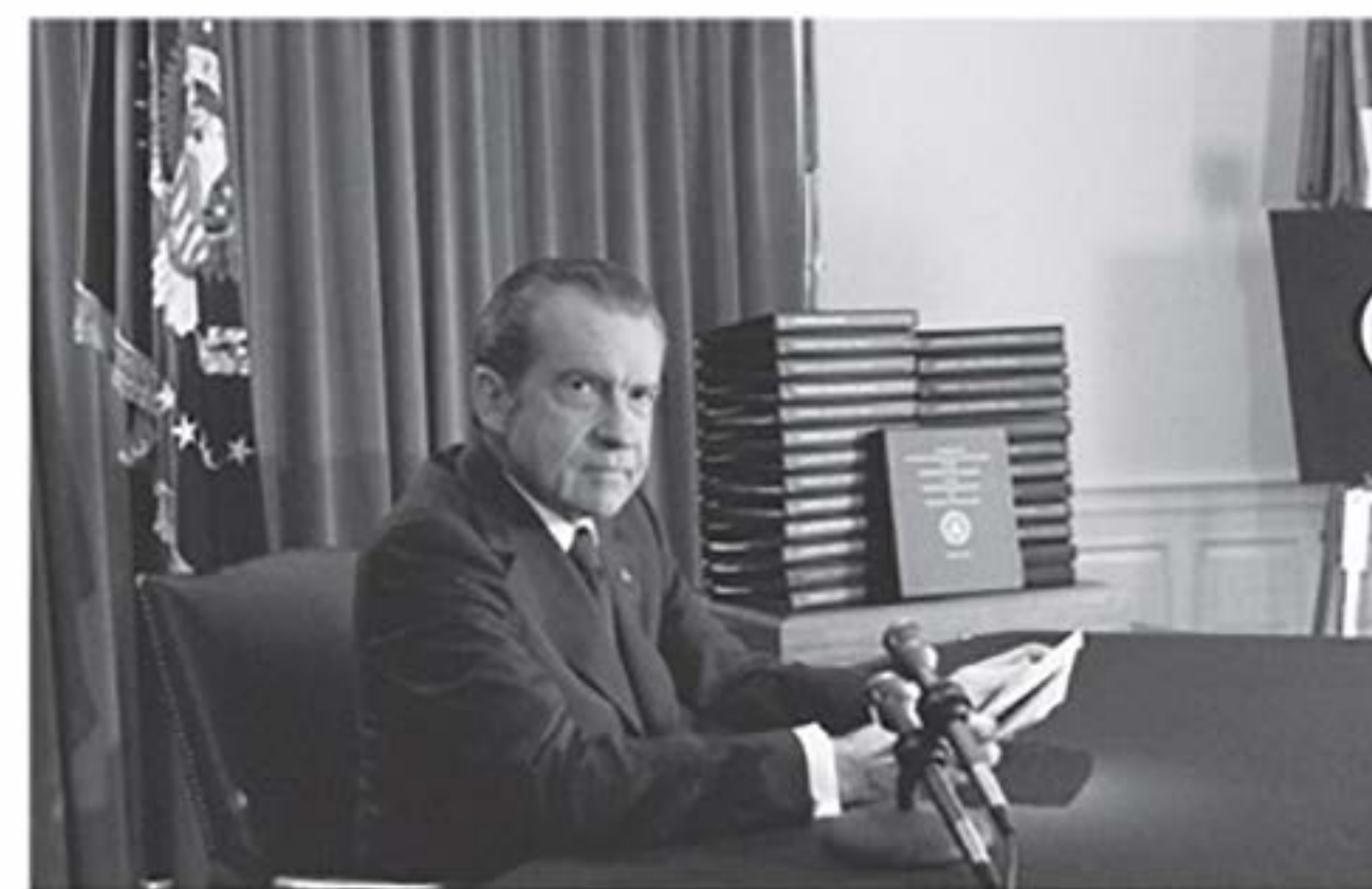
Рис. 2.3. Президент США Річард Ніксон (Richard Nixon) перед зверненням до нації стосовно передання плівок за рішенням Верховного суду, 29 квітня 1974 року.

За рішенням Верховного суду США касети, записані через кілька днів після інциденту у Вотергейті, було опубліковано. На них Ніксон обговорює Вотергейтську історію і способи перешкоджання розслідуванню за допомогою ЦРУ й ФБР. Ніксон, передбачаючи неминучий імпичмент, пішов, нарешті, у відставку. Дотепер не доведений зв'язок цього інциденту з адміністрацією Ніксона. Відомо, що в нього були плівки з нелегально записаними переговорами демократів, але те прослуховування аж ніяк не було пов'язане з готелем «Вотергейт».