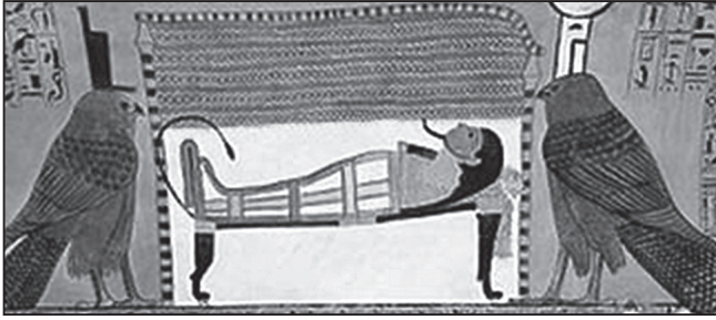
Ізіда і Непфтіс в образах шулік при мумії (XIII ст. до Р.Х.)

Якщо не чіплятися до лінгвістичних і орнітологічних деталей (зрештою, плутанина з шулікою і стерв'ятником є поширеним явищем у египтології як такій), образ птаха і його символічний зв'язок з матір'ю конкретно для Леонардо залишається чинним, тож немає підстав відкидати подальші міркування автора у цьому напрямі, включно з появою силуету «Geier» (стерв'ятника/шуліки) на картині «Святої Анни втрюх». У листі від 17 червня 1910 р. Юнг висловлює Фройді свій ентузіазм з приводу есе, і він перший знаходить на виставленій у Луврі картині обриси грифа, що «його дзьоб саме в паховій області». І аж 1913 р. пастор Пфістер, друг і учень Фройда, публікує статтю, що справила на експертне середовище сумнівне враження. Пфістер знаходить у композиції тієї таки картини іншого Geier (див. у тексті есе). Фройд підтверджує обґрунтованість відкриття у доповненні до видання 1919 р., але визнає, що «не кожен почуватиметься готовим визнати його переконливим».