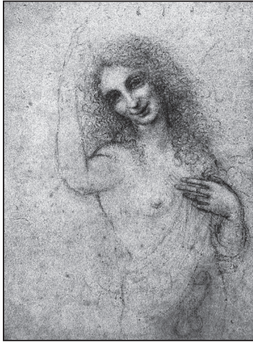
Леонардо да Вінчі. Так званий «Втілений янгол»

Знавець мистецтва З. Фройд міг, однак, помилятися щодо мотивів написання «Святої Анни втрех». Зазначаючи, що Леонардо обрав сюжет, який «нечасто зустрічаємо в італійському живописі», автор не враховує, що саме на той час,