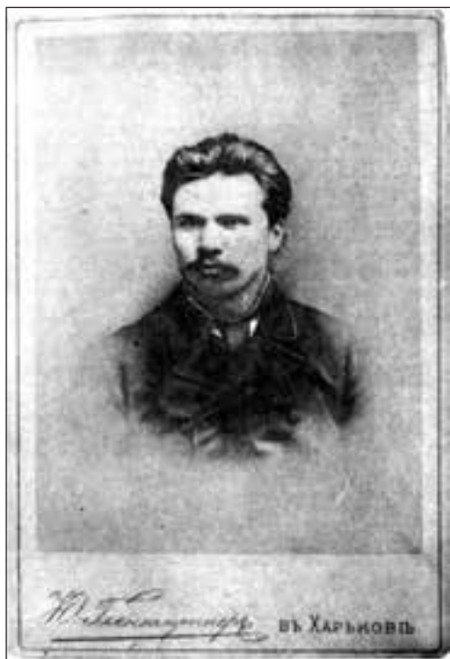
Д. І. Яворницький. Фото. 1885 р. Харків

Основою цієї праці стало десятирічне вивчення життя й воєнних діянь запорізьких козаків, які прославилися безсмертними подвигами в боротьбі за віру, народність і вітчизну. Вся «Історія запорізьких козаків», за планом автора, вийде в трьох томах, причому перший том присвячений виключно зображенню внутрішнього побуту запорізької громади, другий і третій томи присвячені фактичному викладу подій козацьких діянь, починаючи з кінця XV й закінчуючи другою половиною XVIII ст. 1 Головним джерелом при зображенні долі Запоріжжя, крім друкованих українських літописів, польських хронік та різних мемуарів, для автора праці слугували писані документи, розкидані в ба-