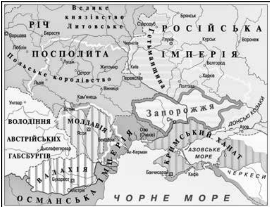
Карта українських земель бл. 1750 р.

Недостатньо відомостей для вирішення питання про границі вольностей запорізьких козаків дає і трактат 1700 року про тридцятирічне перемир'я між Росією й Туреччиною 1 : у ньому є вказівки лише про південну границю запорізьких володінь. «Подніпровські містечка всі розорити, місцям, на яких вони стояли, бути в султанській стороні пустими, та й усім землям по Дніпру від Січі Запорізької до Очакова так само бути пустими. Лише на середині між Очаковом і Кизикерменом бути поселенню для перевозу через Дніпро всіляких проїжджих і торгових людей. Бути біля того поселення оточенню з рівцем і огорожкою, як личить селу, а вигляду городової фортеці й жодної оборони те оточення мати не може. Азову місту з усіма старими й новими містечками й землями та водами між тими містечками бути всім у державі царської величності, а від Перекопу й від краю моря Пере-