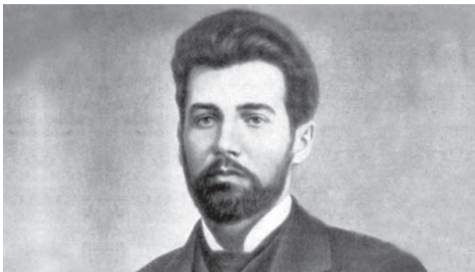
Василь Стефаник (1871—1936 рр.). Суспільне надбання