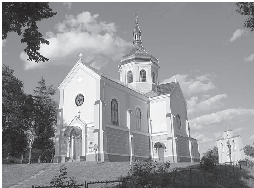
Церква св. Михаїла УГКЦ в с. Зашків 8 . Сучасний вигляд. Суспільне надбання.

Але так було не завжди. В рік заснування Зашків знаходився у складі Галицької землі Польського Королівства (Regnum Poloniae). З 1385 року Польська держава об'єдналася в єдину державу з Великим князівством Литовським, але Зашків продовжував перебувати під управлінням польських королівських династій та користувався магдебурзьким правом.