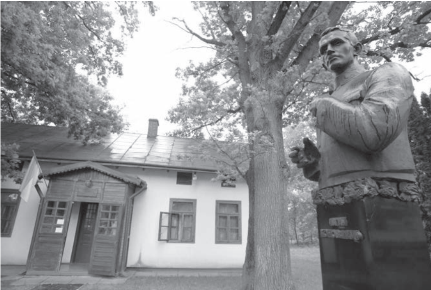
Хата родини Коновальців. Сучасний вигляд. Суспільне надбання