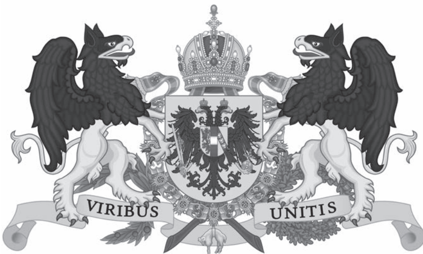
Герб Австрійської імперії. Суспільне надбання