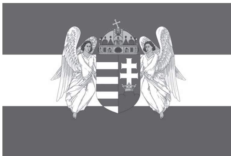
Герб Угорської імперії.