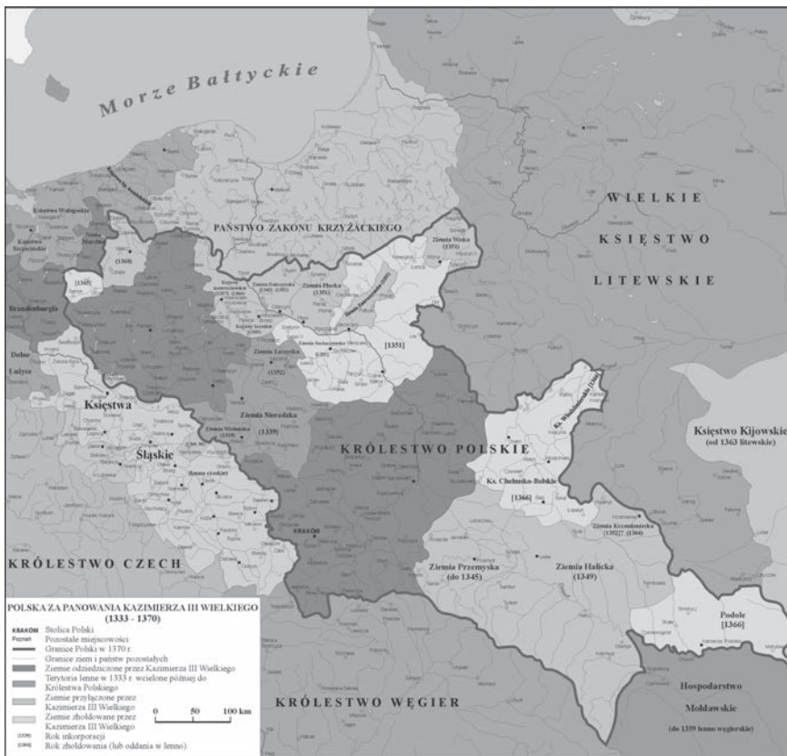
Королівство Польське. 1333 — 1370 рр. Суспільне надбання

нився у складі Габсбурзької монархії аж до її краху в 1918 році. В адміністративному сенсі це Королівство Галичини та Володимирії або т. зв. «коронний край». В той час приватним власником Австро-Угорщини був Франц Йозеф I (Franz Joseph I), імператор Австрійської імперії, Король Богемії, апостольний король Угорщини, король Галичини та Володимирії, великий герцог Буковини.