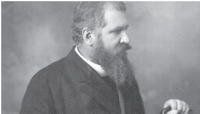
Митрополит Андрей Шептицький (1865—1944 рр.).

сто Імператор та Палати депутатів (Палати послів), яких делегували земельні палати всіх частин двоєдиної держави. Членами першої були, зокрема, Митрополит, граф Андрей Шептицький та видатний український письменник Василь Стефаник.