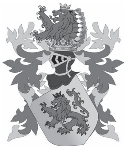
Герб Дому Габсбургів. Суспільне надбання

Вони народилися в Австро-Угорській імперії. Ця держава, (її також часто називають «Дунайською» або Австрійською імперією, Австро-Угорщиною / Die Österreichisch-Ungarische Monarchie) була приватною власністю однієї з наймогутніших європейських династій — Дому Габсбургів (Haus Habsburg). Представники Дому в XII-XIX століттях були Імператорами Священної Римської імперії, в різні роки та століття володіли Мексикою, Німеччиною, Іспанією, Португалією та інших сучасних європейських країн.