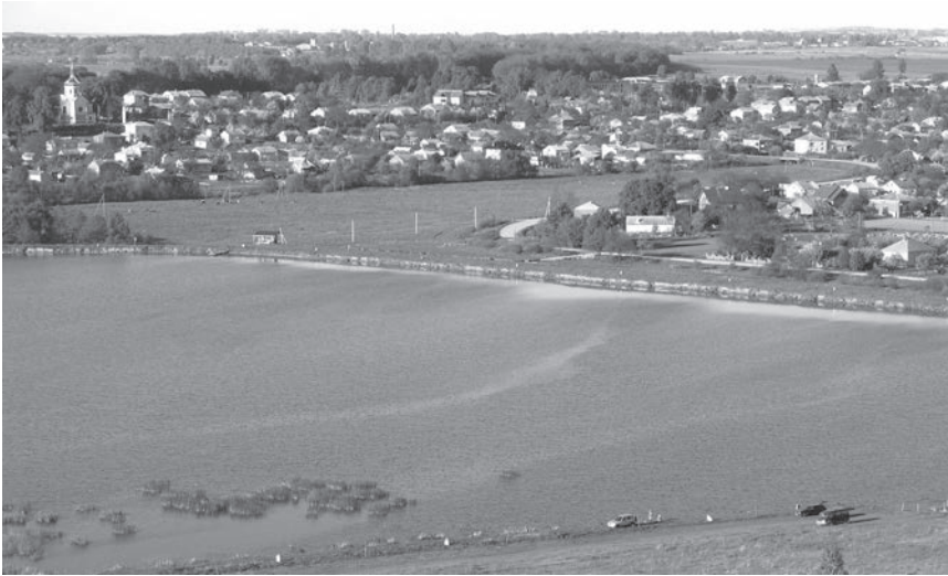
Панорама с. Зашків. Сучасний вигляд.