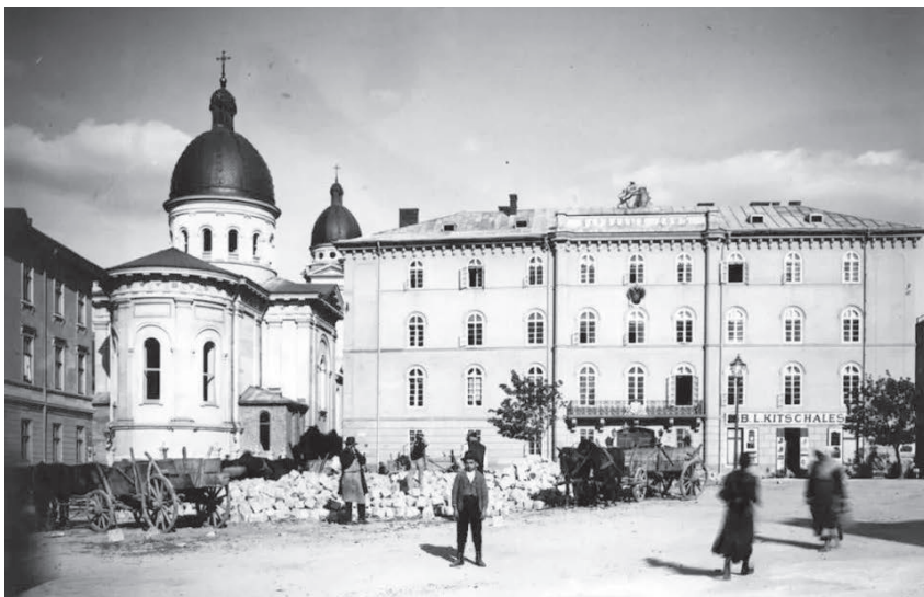
Народний дім у Львові. Суспільне надбання

В 1901 р. продовжив навчання в Цісарсько-королівській академічній гімназії з українською мовою викладання, яка розміщувалася в Народному домі.