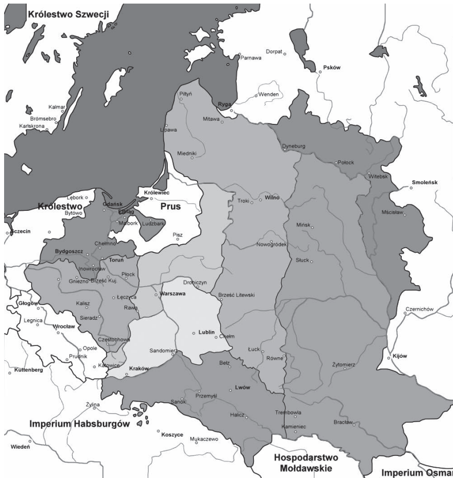
Розділи Речі Посполитої в 1772—1795 рр. Суспільне надбання

В...селі було 223 будинки, в яких проживало 1357 жителів. ...За національністю — 1183 русинів, 167 поляків, 7 німців.