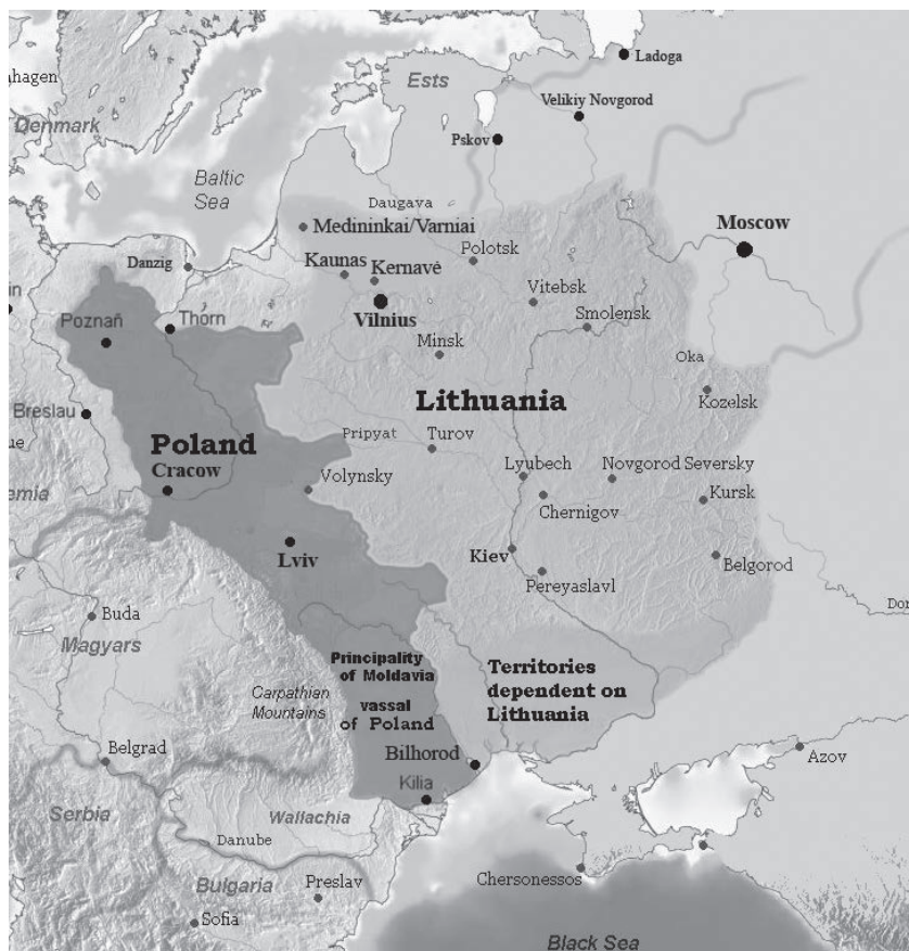
Королівство Польське та Велике князівство Литовське. 1387 р.