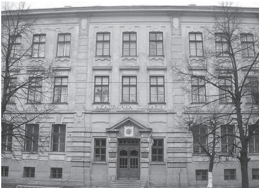
Будинок Львівської академічної гімназії. Сучасний вигляд.

Далі — чотири роки навчання в українській чотирирічній початковій школі при учительській семінарії. Один із небагатьох біографів Коновальця констатує: «в 1901 р. продовжив навчання в Цісарсько-королівській академічній гімназії з українською мовою викладання, яка розміщувалася в Народному домі» 9 , а заснована була за особистим розпорядженням імператора Йосифа II 1784 року і мала ім'я останнього імператора Священної Римської імперії Франца I/II. Випускників цього закладу — сьогодні його з повним правом називали б «елітним» — приймали до університету без вступних іспитів.