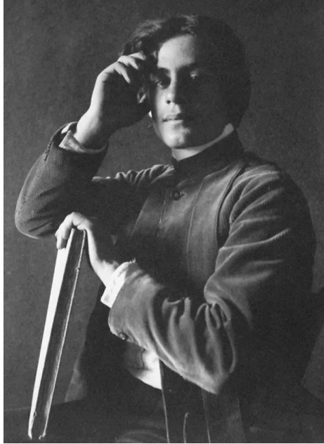
Халіль Джібран у 13 років 1886

до мене, такими добрими. Коли я навчався у коледжі, то отримував листи від них усіх... І вони справді мене любили. І я це відчував. Проте ми не мали нічого спільного 5 .