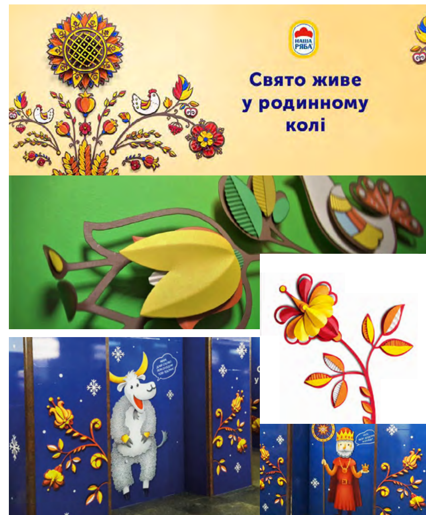
Агенція Rockets. Growth R&D. Рекламна продукція для ТМ «Наша Ряба». 2017–2018.