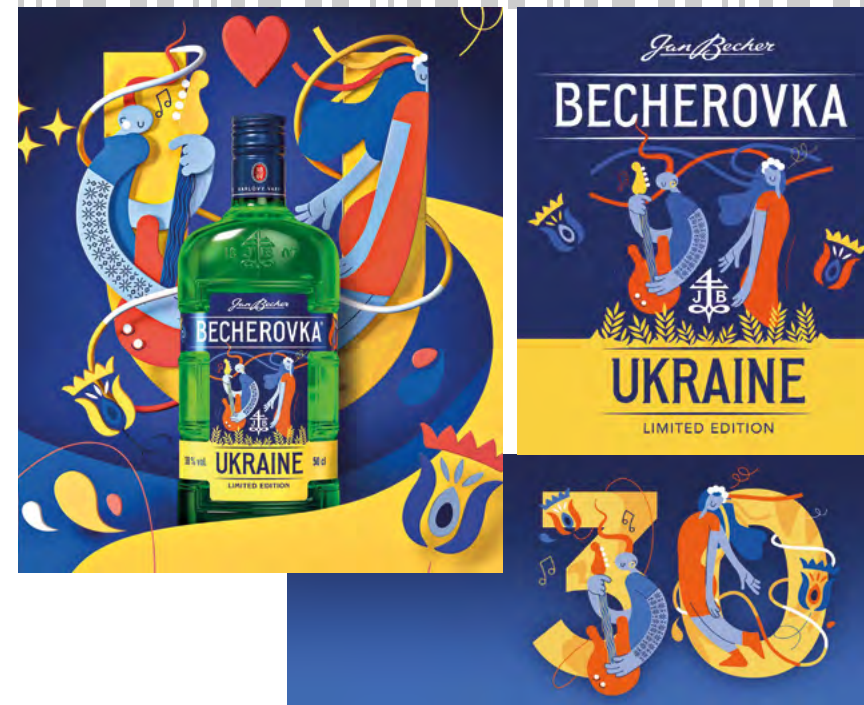
О. Роговець. Етикетка та ілюстративний супровід лімітованої партії «Becherovka Ukraine». 2022.