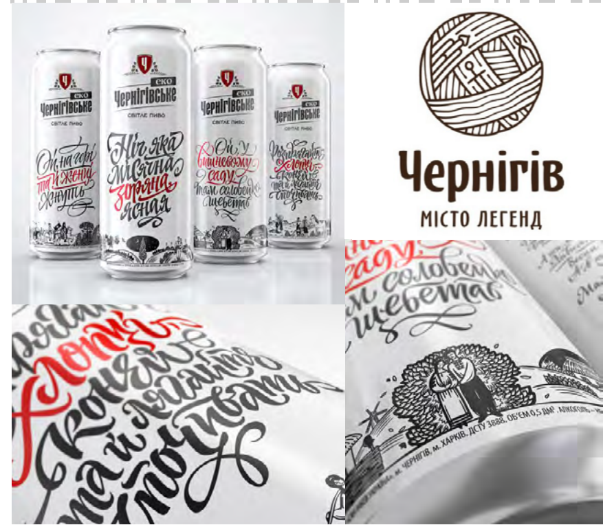
А. Сторожев Знак міста Чернігова. 2010.