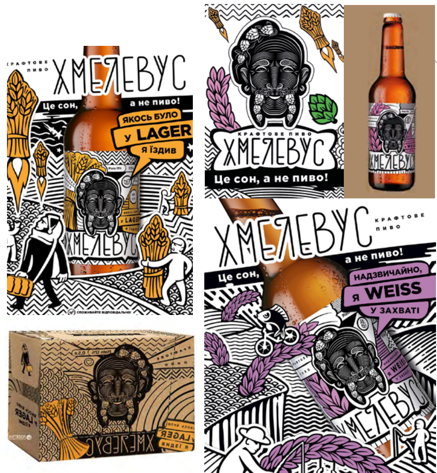
Комунікаційна група AGAMA. Бренд крафтового пива «Хмелевус». 2018.