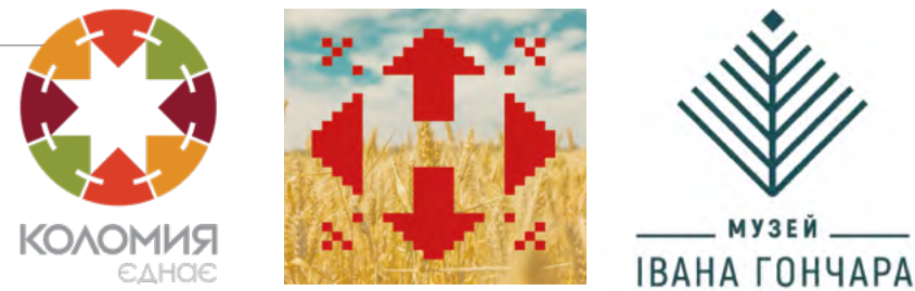
В. Граціанський. Знак міста Коломія. 2016.