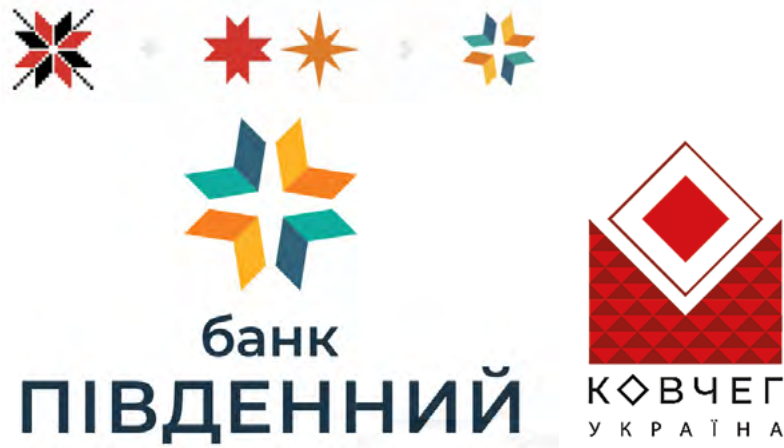
К. Моргенталь. Знак культурної платформи «Ковчег Україна». 2020.