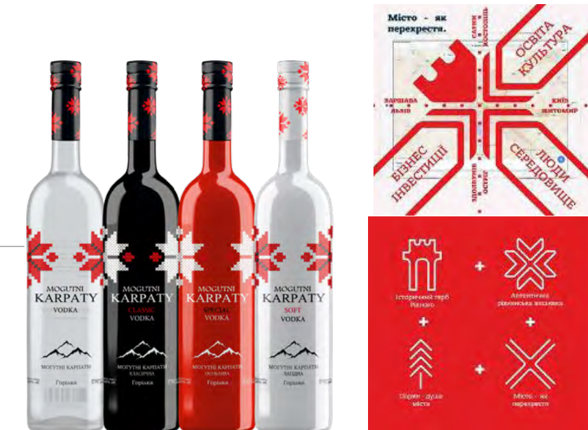
Данко Декор. ТМ Могутні Карпати. 2017.