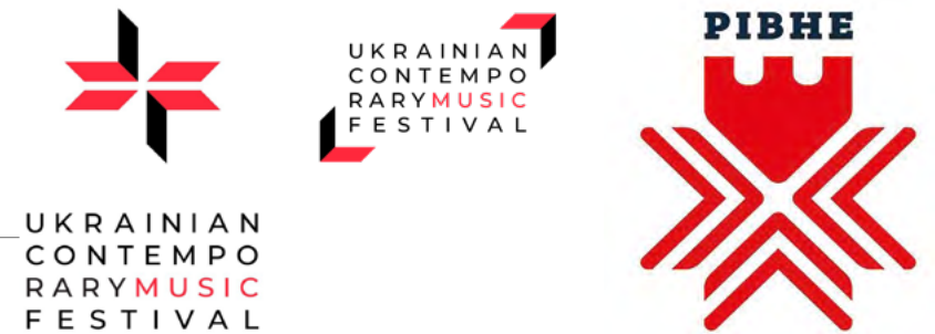
Знак проекту Ukrainian Contemporary Music Festival (USA). 2020.