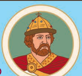
8 Володимир Мономах. Великий князь Київський. 1053–1125