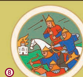
8 1237–1241 рр. – монгольська навала на Русь.