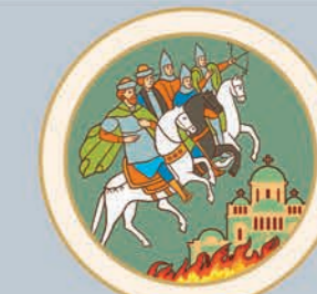
6 У 1169 році князь Андрій Боголюбський захопив і спустошив Київ.