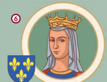
6 Анна Ярославна. Королева Франції. 1032(?)–1075/1089