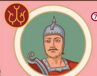
7 Ізяслав Ярославич. Великий князь Київський. 1024–1078