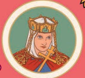
2 Княгиня Ольга. Княгиня Київська. 910(?)–969