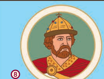
8 Володимир Мономах. Великий князь Київський. 1053–1125