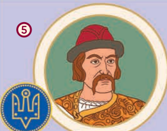
5 Ярослав Мудрий. Великий князь Київський. 983/987–1054