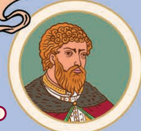
1 Олег Віщий. Регент київського князя Ігоря. 850(?)–912/(922?)