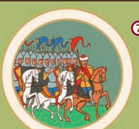
7 Похід Ігоря Святославовича на половців. Героїчна поема «Слово о полку Ігоревім». 1185 р.