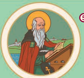
5 У 1113 році Нестор Літописець завершив літопис «Повість временних літ».