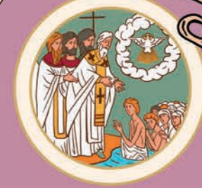
2 Хрещення Русі у 988 році. Християнство візантійського обряду стає державною релігією Київської Русі.