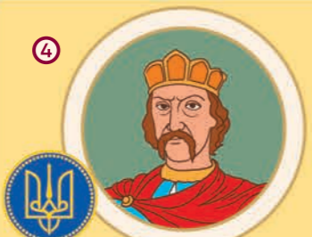
4 Володимир Великий. Великий князь Київський. 960/963–1015