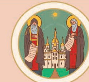
4 1051 р. – заснування Києво-Печерської лаври.