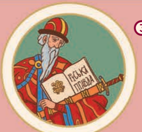
3 «Руська правда» Ярослава Мудрого – правовий кодекс Київської держави XI–XII ст. 1016(?) р.