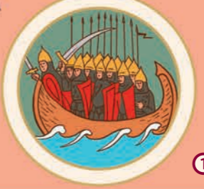
1 У 882 році Олег Віщий захопив Київ та оголосив його столицею давньоруської держави – «хай буде се мати городам руським».