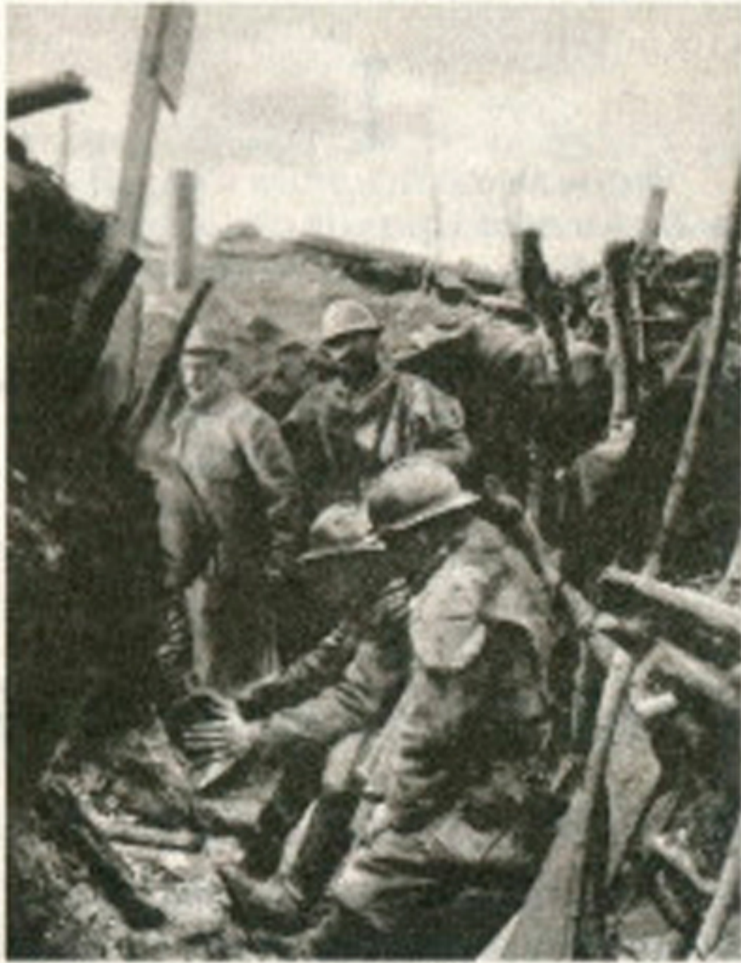
Французькі солдати в шанцях під Верденом. 1916 рік. Перша світова війна з її наслідками висіла тінню над країнами Європи протягом наступних 20 років

«Подвійна монархія» розвалилася навпіл, і від обох її частин Сен-Жерменська та Тріанонська мирні угоди відірвали величезні шматки на користь як держав, що існували до початку світової війни, так і тих, що виникли внаслідок її. Німецько-Австрійська республіка, проголошена після поразки у війні, була змушена відмовитися від згадки про німецькість у своїй назві, від територій, населених майже винятково німцями, на історичних землях Чехії та Моравії та в Південному Тиролі. Їй було заборонено об'єднатися в одну державу з Німеччиною. Болгарія втратила вихід до Егейського моря, Османська імперія втратила всі володіння за межами Малої Азії і ще півдесятиліття корчилася в конвульсіях внутрішніх та зовнішніх збройних конфліктів.