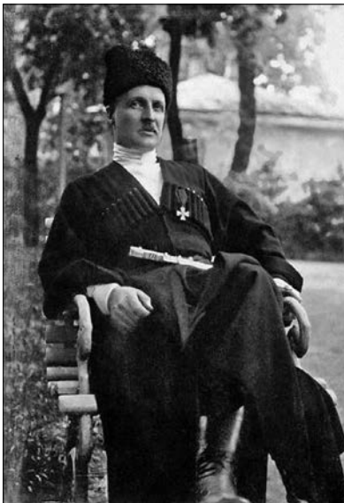
Гетьман Української Держави П. Скоропадський (1873—1945 рр.). Суспільне надбання

Перша. «Основа державного суверенітету у П. Скоропадського — територія, тому його розуміння суверенітету можна визначити як територіальний суверенітет... Ідея державного суверенітету у П. Скоропадського логічно поєднана з ідеєю соборності України».