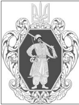
Герб Української Держави. Суспільне надбання

Між тим, знаходимо і виверені, адекватні, науково обґрунтовані оцінки. Наприклад, такі.