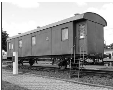
Вагон-музей злуки УНР та ЗУНР. Фастів. Сучасний вигляд. Суспільне надбання