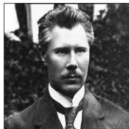
Ф. Швець (1882—1940 рр.). Суспільне надбання

Останній фундаментальний висновок «з огляду на те, що Директорія УНР не вико-