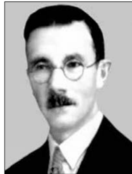
І. Мазепа (1884—1952 рр.). Суспільне надбання