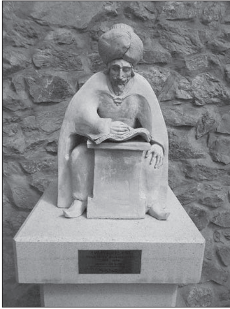
Пірос Ростас Беа. Пам'ятник Евлію Челебі

Італійські місіонери Джовані Куліано і Патрі Лука дали опис однієї грузинської церкви на узбережжі, де «на трапезі стояла одна тарілка з грішми золота і срібла, спитав священника — хто пожертвував ці кошти, той відповів — козаки, вони з річок Дону та Дніпра човнами заходять у Чорне море на грабіжницькі рейди проти османів і татар, і коли повертаються зі здобиччю, тут, у церкві, моляться і залишають кавказцям гроші».