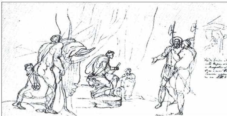
Христофоро де Кастеллі. Нариси із Самегрело, 1640-ті рр.

Так чи інакше, Василь потрапив до Грузії хоч і не добровільно, але посів гідне місце й, судячи із записів послів, навіть був радником Левана II Дадіані щодо геополітичних питань, пояснюючи князю відмінність церков Московії та Литви, з якою Дадіані хотів встановити відносини. Він був одним із тих, хто й раніше плавав на торгових човнах до