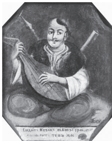
Автор невідомий. Козак Мамай. XVIII ст.

султанські галери (військові кораблі) виявили дванадцять козацьких човнів «в гирлі однієї річки в країні Мегрелії за Трапезундом» і триста козаків, які там «оселилися й закріпилися».