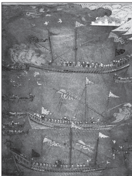
Невідомий турецький автор. Зіткнення української чайки з турецькими галерами, 1636 р.

ли справжню морську війну, стверджував історик козацтва Володимир Корольов. Постійні нальоти на османські укріплені фортеці й військово-морські бази, порти й торговельно-ремісничі центри, напади на сам Стамбул, призвели до того, що за однієї згадки про появу на обрії козачого струга або чайки купецькі судна припиняли виходити в море, команди кидали їх напризволяще, населення приморських селищ, залишаючи майно, рятувалося в містах або навколишніх горах, а солдатів доводилося палицями заганяти на кораблі, що їх надсилали проти козацьких флотилій.