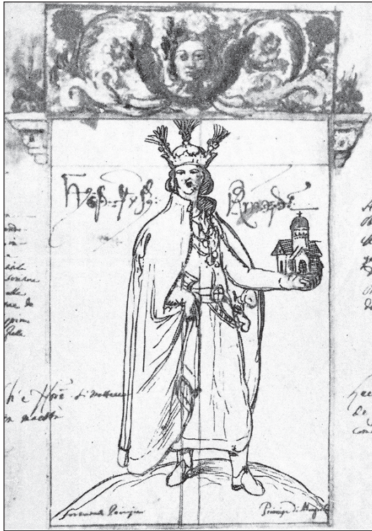
Леван II Дадіані. Картина Христофоро де Кастеллі. 1640-ві рр.

Якщо говорити про те, хто з українців першим відвідав Грузію, то єдиним поки що відомим джерелом є опис посольства Гавриїла Гегенава, Федота Єлчана і Павла Захар'єва 1636–1640 років. У період з 1 до 5 лютого 1640 року посольство провело декілька зустрічей у Корцхелі з єпископом Андрієм, який повідомив послам про смерть дружини володаря Левана II (у рукописі Леонтій).