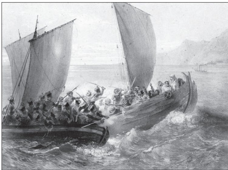
Григорій Гагарін. Азовські козаки беруть на абордаж турецький корсар

Написання «козак» українською або «казак» у російській історіографії не суперечать одне одному. Інша річ в інтерпретації людей цієї спільноти, коли в Росії заведено називати їх «росіянами», хоча перша згадка «козаків» сягає XIV століття та згадується в значенні «вартового» в писемній пам'ятці — багатомовному перекладацькому словнику куманської (старокипчацької) мови 1303 року, коли самої Росії як держави ще й близько не було, але вже формувалося