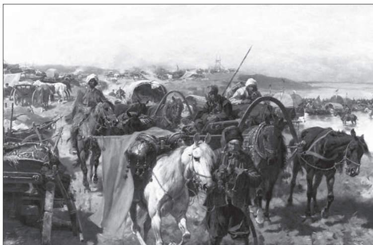
Юзеф Брандт. Обоз запорожців. 1880 р.

ко. Майже всі «корінні» українці, чіїх предків переселили до Грузії в середині XIX століття, розмовляють грузинською, вважаючи її рідною. Лише з прізвиськом Мартиненко нині в Грузії мешкає близько трьох тисяч людей.