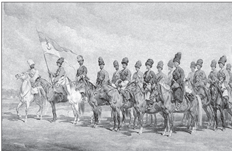
Юліуш Коссак. Донські козаки. 1877 р.

об'єднання людей, які два століття потому називали себе «запорізькими козаками».