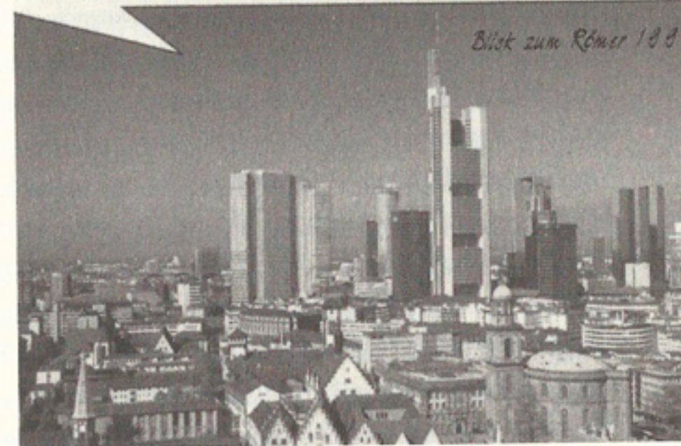
Blick zum Römer 1983

годину вони залишалися на батьківщині, тоді як інші відсиджувалися на почесних місцях в Америці. Проте вони цілком утрималися від коментарів про перебіг та кінець руйнування, очевидно, також через острах, що реалістичні описи дискредитують їх перед окупаційною владою. Всупереч загальній думці, сучасний дефіцит спогадів не надолужила й повоєнна література, яка свідомо створювалася з 1947 року й від якої варто було сподіватися принаймні