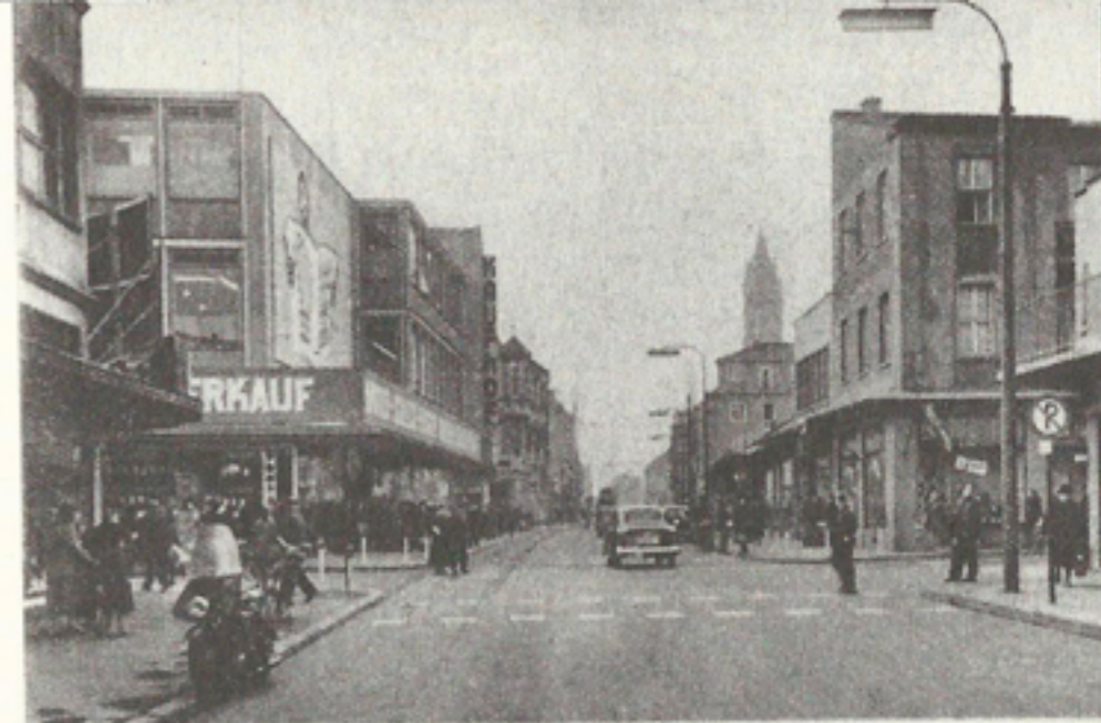
Schöner und breiter erstand sie wieder

вулицями «посеред жахливих руїн, — пише Альфред Деблін із південно-західної Німеччини у датованій кінцем 1945 року нотатці, — так ніби нічого й не трапилось... і місто виглядало так завжди» 3 . Зворотним боком такої апатії було проголошення нового початку, незаперечного героїзму, з яким не гаючи часу слід було розпочати роботи з реорганізації та розчищення. У брошурі, присвяченій місту Вормс 1945–1955 років, сказано: «Наразі потрібні незламні люди, чисті у своїх вчинках та прагненнях. І навіть у майбутньому майже всім доведеться роками залишатися в авангарді відбудови» 4 . У тексті, написаному на замовлення міської адміністрації таким собі Віллі Руппертом, подано численні фотографії, а серед них — дві світлини Кеммерер-штрассе, відтворені тут. Отже, це тотальне руйнування виглядає не як жахливий кінець колективного збочення, а як, так би мовити, перший етап успішної відбудови. Після закінчення розмови з керівництвом фірми IG-Farben у Франкфурті, що