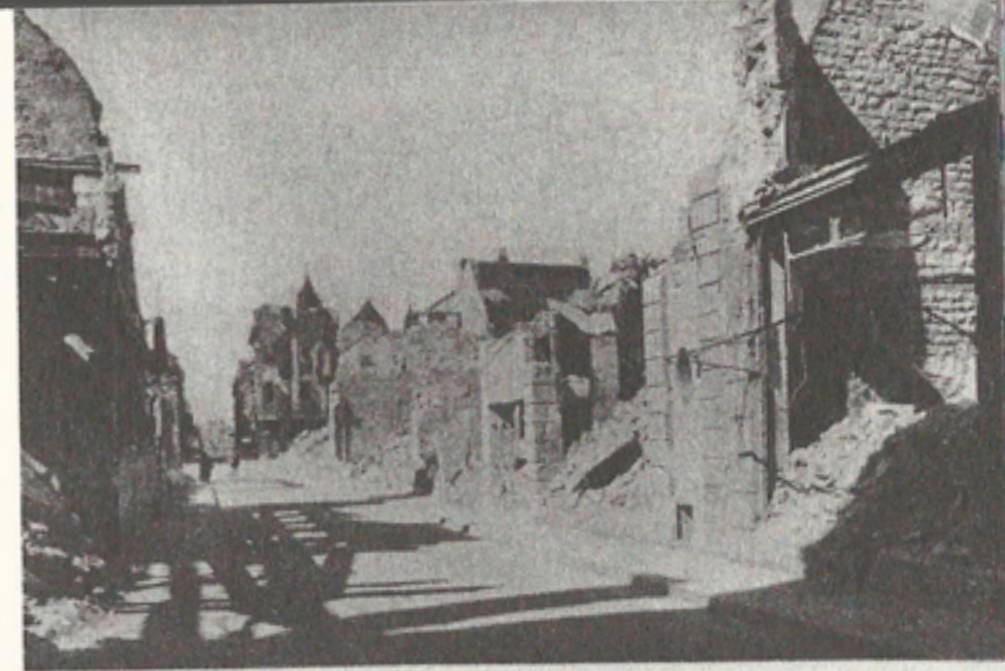
Kammererstraße: Kein Haus überstand das Inferno

мільйон тонн бомб, що зі 131 міста, які зазнали масованого бомбардування, а часом і повторного, деякі були буквально стерті з лиця землі, що приблизно 600 000 цивільних у Німеччині стали жертвами повітряної війни, що було знищено три з половиною мільйони квартир, що на кінець війни бездомними були сім з половиною мільйонів осіб, що на кожного мешканця Кельна припадало 31,4, а на кожного дрезденця — 42,8 кубічних метрів щебеню, ми однаково не знаємо, що все це насправді означає 2 . На той момент абсолютно виняткова в історії операція винищення увійшла до анналів нації, що формувалася заново, лише у вигляді розпливчастих узагальнень і, здається, майже не залишила больового сліду в колективній свідомості, значною мірою була усунута з ретроспективного досвіду потерпілих, а в дискусіях про внутрішній стан нашої країни ніколи не відіграла якоїсь суттєвої ролі, ніколи, як пізніше зазначив