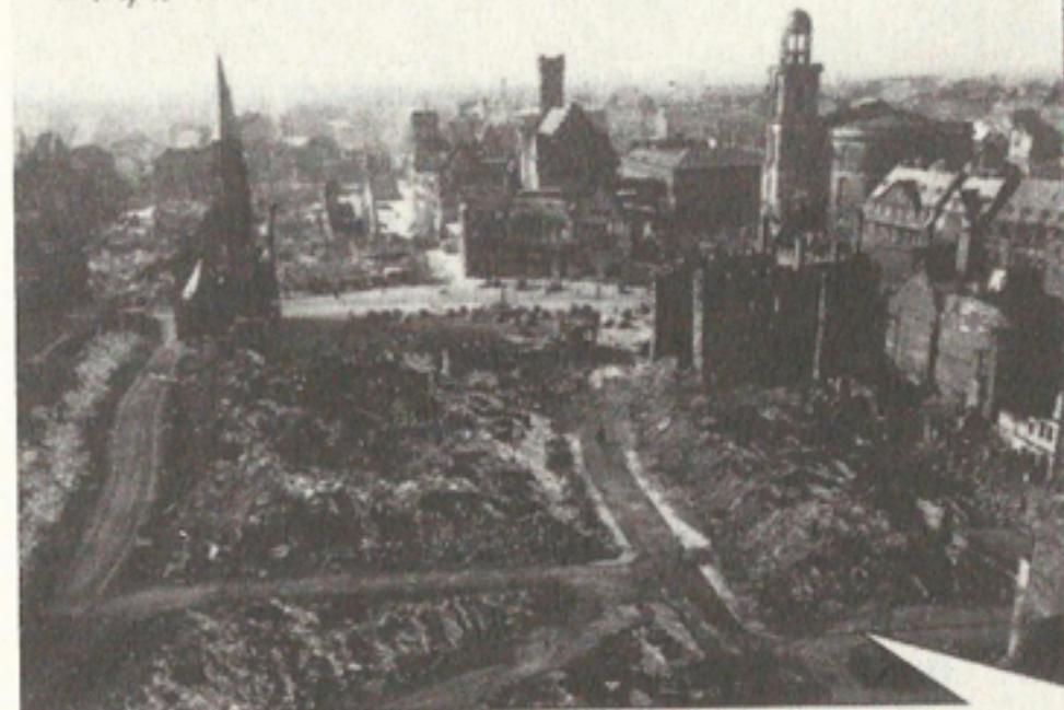
Blick zum Römer 1944