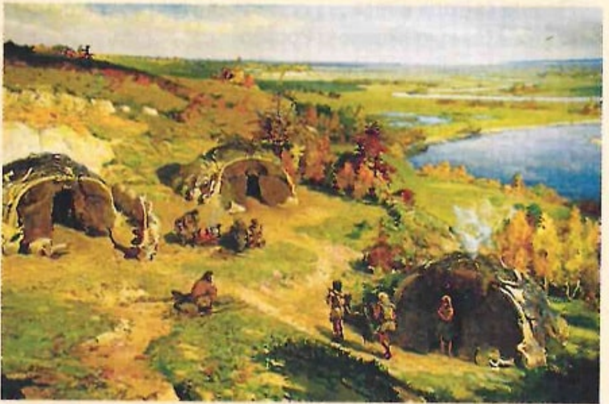
«Мезинська стоянка» Картина Івана Іжакевича