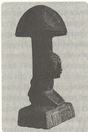
Великий камінь-гриб з високогірної Гватемали (1000–500 роки до н. е.)

міфічні сутності, паранормальні субстанції чи молодші асистенти богів різного штибу. Магічне мислення й тут показало своє безсилля, зосередивши основні bastiони впливу в чатиках конспірологів.