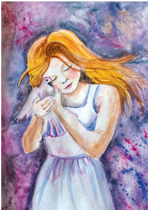
Доброта. Ілона Шустер, 14 років, м. Галич (Івано-Франківська обл.)