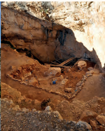
Червона скеля біля Нікшича