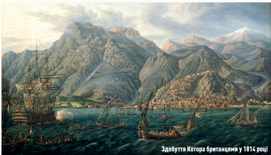
Здобуття Котора британцями у 1814 році