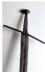
Меч XII століття

У 1095 році Урбан II закликав християнських володарів вирушити у хрестовий похід до Святої Землі, щоб звільнити Гроб Господень від влади мусульман. Вже за рік біля берегів Дуклі з'явилася військо хрестоносців на чолі з Раймондом Тулузьким. Зазвичай до лицарів-мандрівників місцеві мешканці ставилися вороже, як до несподіваних нахлібників, які до того ж не гребували крадіжками та відвертим розбоєм. Але Бодін зустрів прибульців дуже гостинно і навіть став побратимом Раймонда. Для відпочинку та облаштування табо-