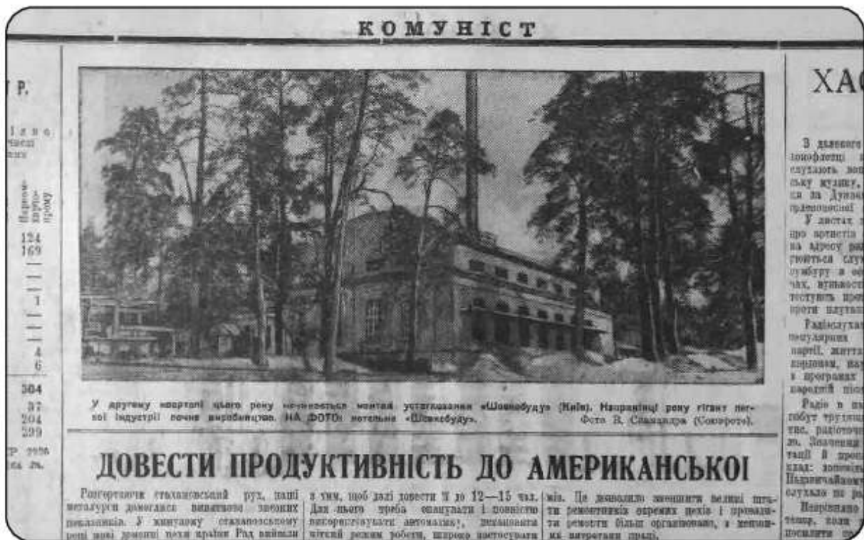
Фото в газеті «Комуніст», на якому хтось побачив обличчя Троцького. 1937 р.

Саме таке повідомлення відправив у Москву заступник наркома внутрішніх справ УРСР В. Іванов.