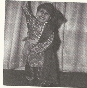
Сповнений ентузіазму в чотирирічному віці

Я виріс у робітничому селищі з п'ятьма тисячами мешканців. Поблизу океану. У невеличкому будиночку. Дитина батьків-емігрантів з дуже добрими серцями. Я не в сорочці народився, це однозначно.