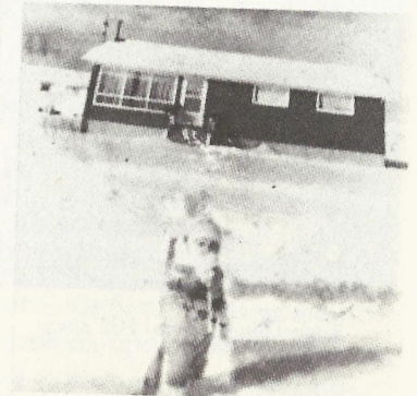
Бавлюся в снігу перед нашим будинком

Так, це я беру участь у шкільній виставі. У дворі перед будинком дуже холодної зими. Бачите, жодної «Феррарі» на дорозі. Ніяких розкошів і панських витребеньок. Усе найнеобхідніше. Найкращий спосіб буття.