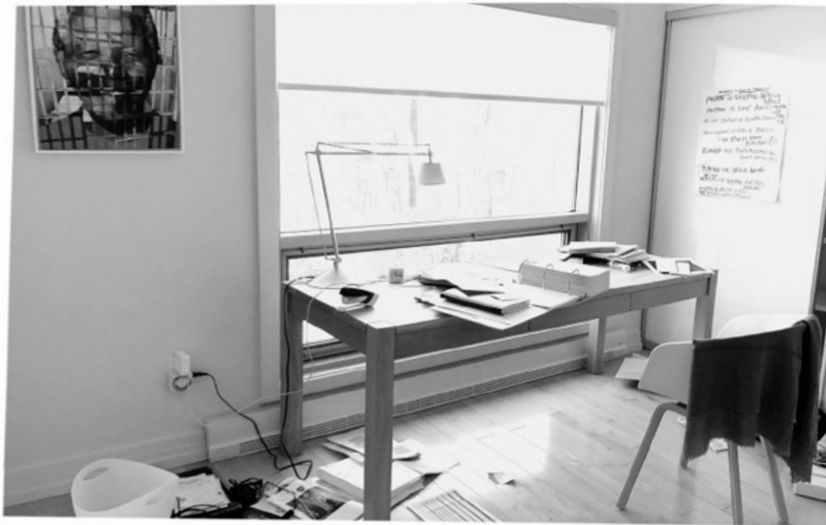
Одне з моїх найулюбленіших місць для творчості вдома

Покажу вам це місце, щоб ми з вами ще більше зблизились: