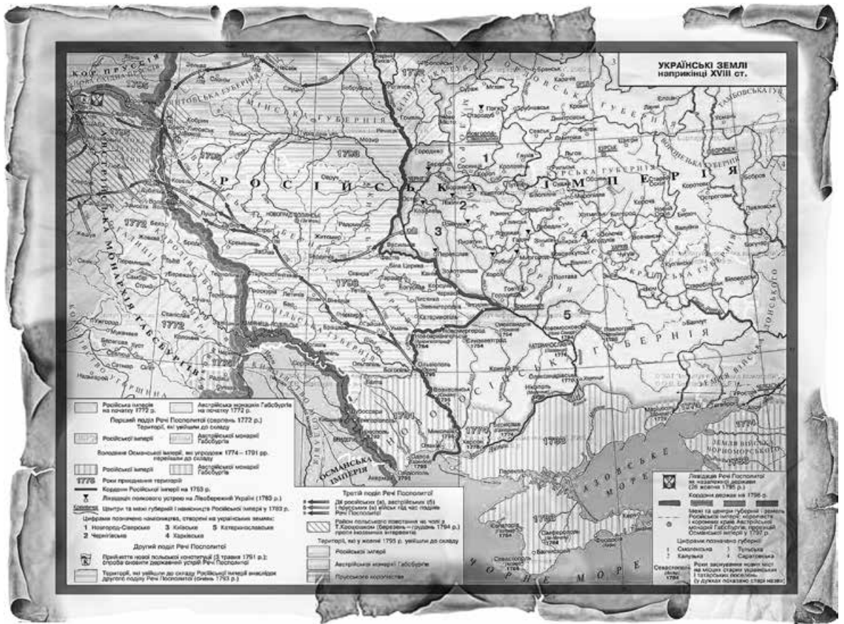
Територія сучасної України у складі Російської імперії та монархії Габсбургів

Звернімо увагу: ані І. Мазепа, ані його попередники або наступники на посаді козацьких гетьманів/герцогів/головнокомандувачів жодним легітимним правителем Європи як державні діячі ніколи не визнавалися. Так само як і не визнавався державний статус т. зв. Гетьманщини, яка формально залишалася складовою невід'ємною частиною Речі Посполитої аж до часу остаточної та формальної окупації Російською імперією.