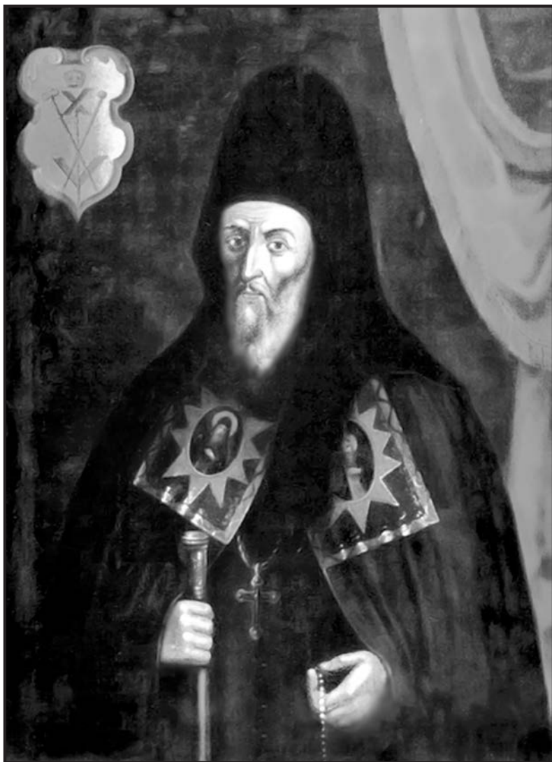
Інокентій Гізель. Копія з портрета XVII ст.