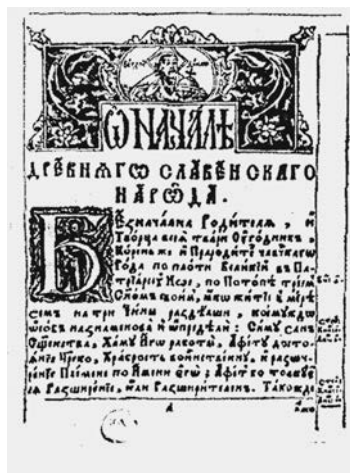
Сторінка «Синописа», Київ, 1680 р.

Зміст «Синописа» — компіляція нічим не обґрунтованих