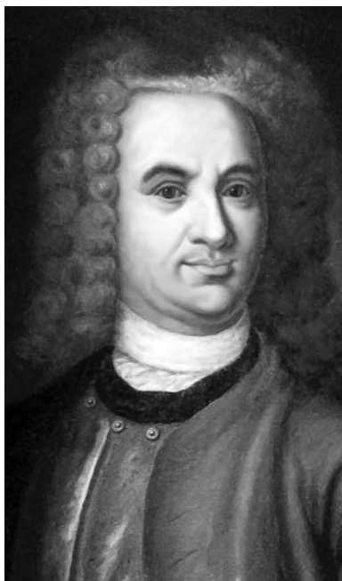
В. Татищев (1686—1750)

Відповідь на це запитання давно і добре відома. Прадідом сучасної концепції історії України був відомий кожному студентові-історикові Василь Татищев.