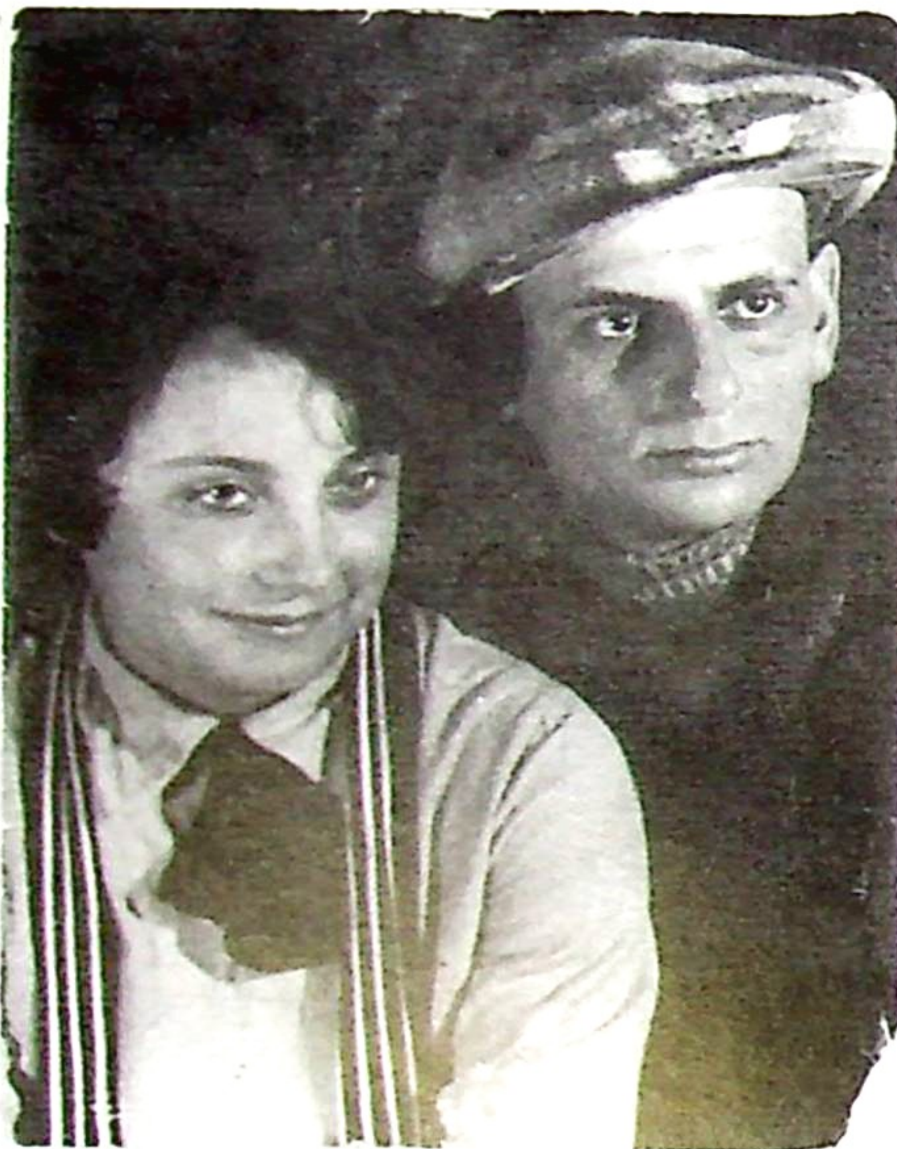
3. Толкачов з дружиною Розарітою, 1920-ті

Толкачов є визнаним майстром книжкової та станкової графіки. Багато уваги він приділяв і живопису, а в 1920-ті роки — монументальному розписові. Створив чимало плакатів, написав низку мистецтвознавчих текстів і спогадів. Він випробував чимало різноманітних графічних і живописних технік, що своєю специфікою допомагали виразніше втілити творчі задуми. Перелік самих лише суто графічних засобів становить цілий список: офорт, кольоровий офорт, чорно-біла й кольорова ліногравюра, дереворит, чорно-біла й кольорова літографія, трафарет, шовкографія.