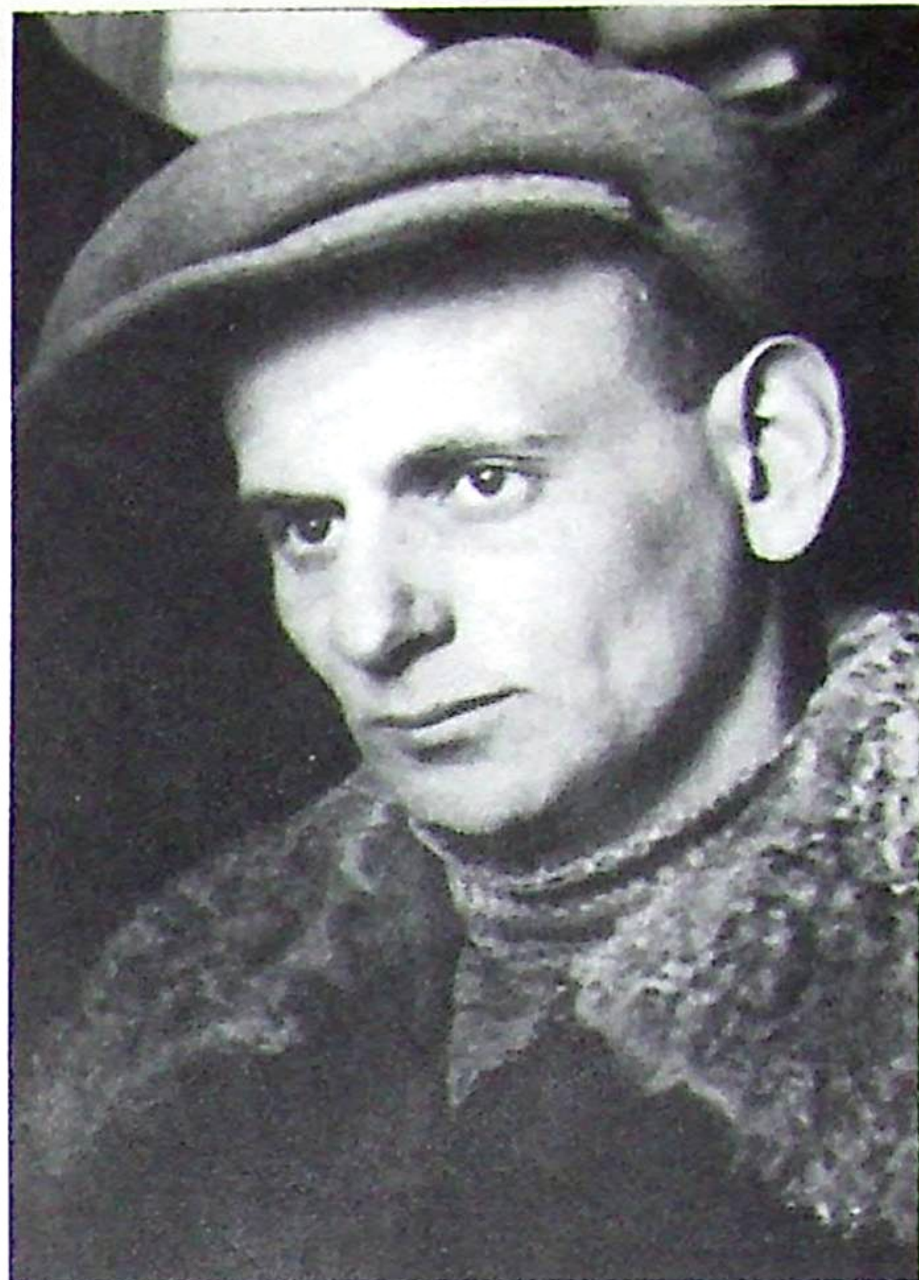
3. Толкачов, 1930-ті

Обидва свідчення — це реакції людей на дотик до Темряви. Слід зазначити, що автори більшості спогадів бачили лише якийсь фрагмент жаху, тоді як доля Толкачова була більш суворою. Він довгий час перебував поруч із наслідками концентрованої форми Темряви: у таборі, до якого він увійшов, ще залишалися як живі свідки езекуцій, так і тіла страчених. Він писав: «За вікнами їх чекали печі крематорію <...> Все змішалось: трупи, одяг, брудне ганчір'я. Чорні сараї вщерть набиті трупами. О, ці мертві голови, що волають! <...> А поряд захололі в останніх судамах руки матерів <...> Вони невідступно стоять перед моїми очима» [Толкачов 1985b, с. 129].