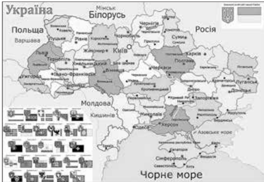
Україна. Адміністративна карта.