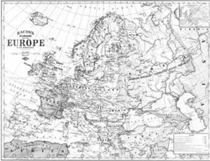
Європа. 1923 р. Суспільне надбання

Насамкінець вважаю необхідним наголосити окремо на обставинах, які вперто, послідовно, принципово ігнорували та ігнорують покоління українських і не тільки дослідників поза країнами їх проживання.