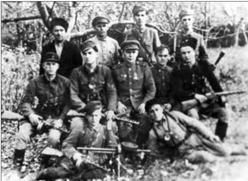
«Легендована» спецгрупа МГБ.

Четверте: ані сучасна держава Україна, ані її громадяни не несуть відповідальності за дії, вчинки та злочини, які, можливо, вчиняли, вчиняють і будуть вчиняти етнічні українці, громадяни американських та європейських держав.