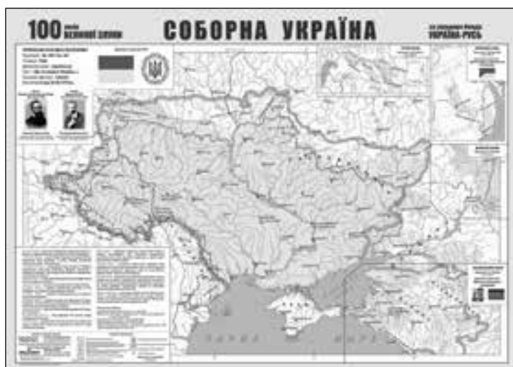
Українська Самостійна Соборна Держава.