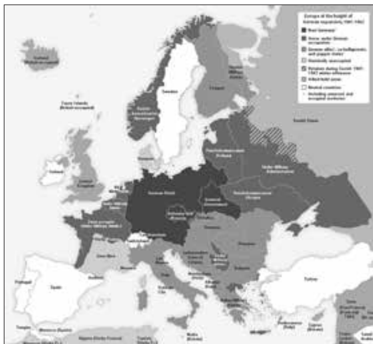
Європа. 1940 р. Суспільне надбання