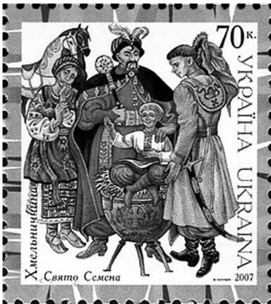
Поштова марка України. 2007 р.