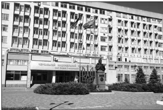
Черкаський національний університет імені Богдана Хмельницького

Указом Президії Верховної Ради СРСР від 10 жовтня 1943 р. був встановлений орден Богдана Хмельницького, призначений для нагородження командирів та бійців Червоної армії і Військово-Морського флоту, керівників партизанських загонів і партизан, які особливо відзначилися під час звільнення радянської землі від німецьких загарбників 7 . Як бачимо, з'явилася ця нагорода у часи т. зв. «Великої Вітчизняної війни», коли існувала потреба мобілізувати українців для захисту «соціалістичної вітчизни». У 1995 р. у незалежній Україні орден Богдана Хмельницького був встановлений на відзнаку видатних заслуг громадян України, а також іноземних громадян та осіб без громадянства перед Українською державою 8 .