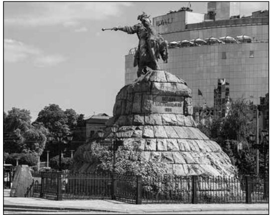
Пам'ятник Гетьману України Богданові-Зиновію Михайловичу Хмельницькому в Києві

Вулиці Богдана Хмельницького є в багатьох українських містах, навіть у селах. Є такі вулиці й у містах Росії, Білорусі й Казахстану. Зокрема, в цих державах вулиці Хмельницького знаходяться в столичних містах. У Москві вулиця Богдана Хмельницького — це колишня Маросейка (саме на ній після Переяславської ради селилися вихідці з Малоросії, тобто України). У Казахстані вулиці Хмельницького є в колишній столиці Алмати й нинішній Астані 2 . Існує чотири проспекти Богдана Хмельницького — у Дніпрі, Мелітополі і... нині захопленому проросійськими сепаратистами Донецьку. А ще є такий проспект у місті Біл-