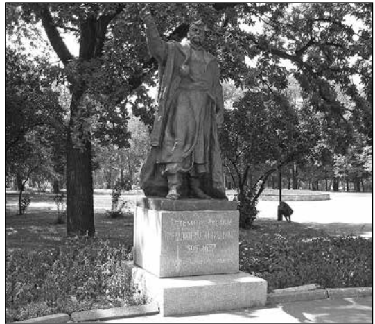
Пам'ятник Богданові Хмельницькому на острові Хортиця