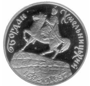
Пам'ятна монета 200 тисяч карбованців, 1995 р.