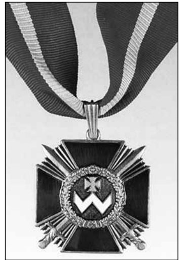
Орден Богдана Хмельницького

Автор пропонованої роботи спочатку спробує розібратися з тим, як творилися образи Хмельницького, різні міфи про нього. Далі подаватимуться реальні факти, що стосуються діянь Хмельницького, а також той контекст, у якому вони відбувалися. На завершення подане осмислення діяльності Хмельницького в історичному процесі.