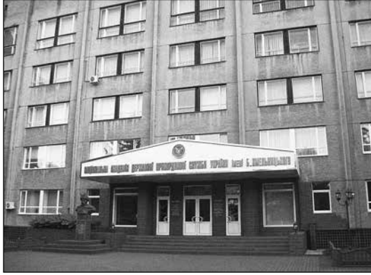
Національна академія Державної прикордонної служби України імені Богдана Хмельницького в місті Хмельницькому

Іменем Хмельницького названі й міста. У 1943 р. Переяслав було перейменовано на Переяслав-Хмельницький 2 . А в 1954 р., у рік 300-літнього ювілею Переяславської ради, Проскурів перейменували на Хмельницький 3 . Відповідно, область, центром якої стало це місто, почала називатися Хмельницькою.