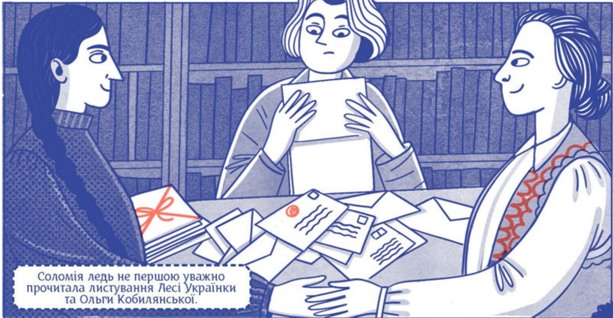
Соломія ледь не першою уважно прочитала листування Лесі Українки та Ольги Кобилянської.