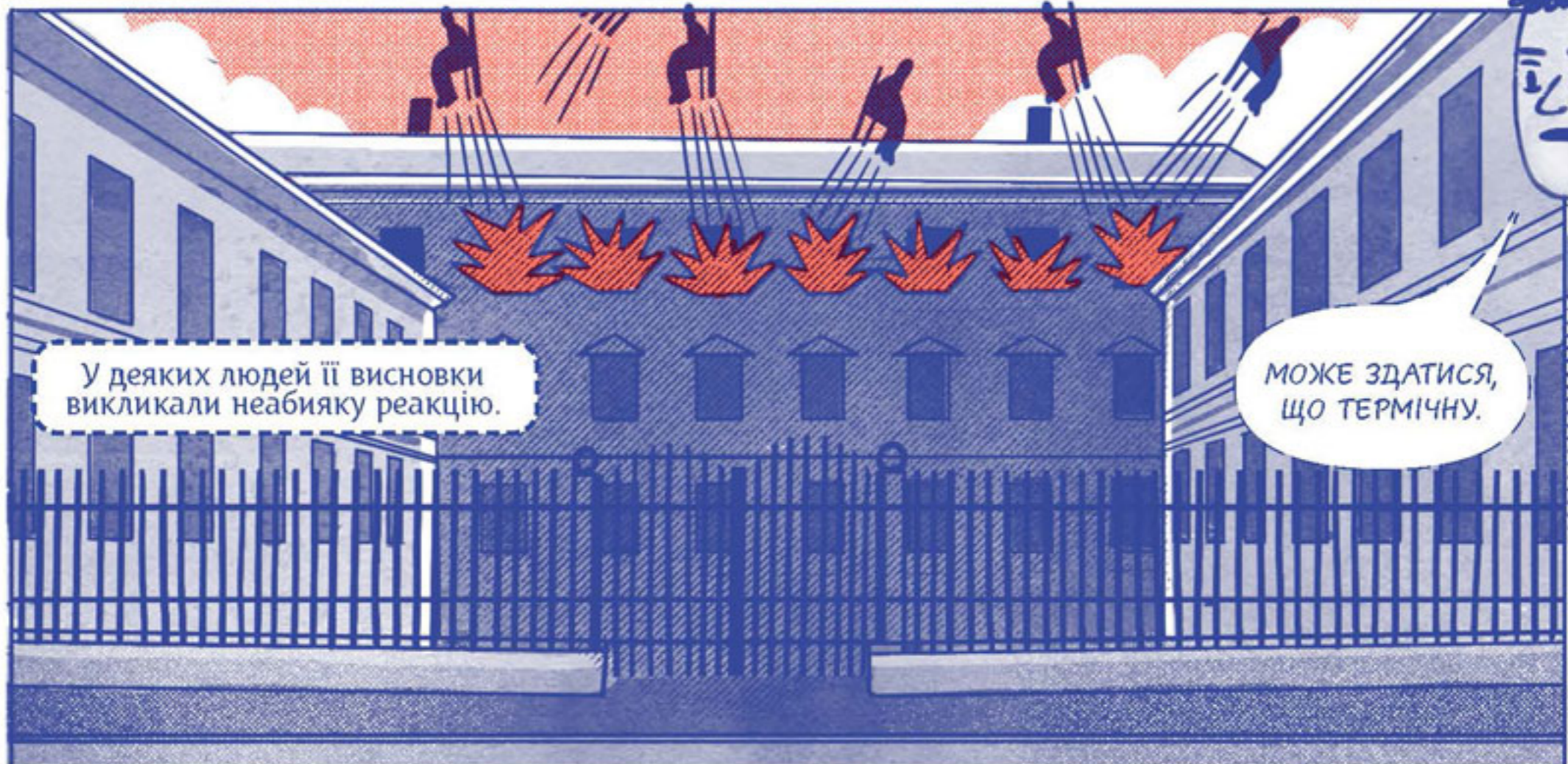
У деяких людей її висновки викликали неабияку реакцію.