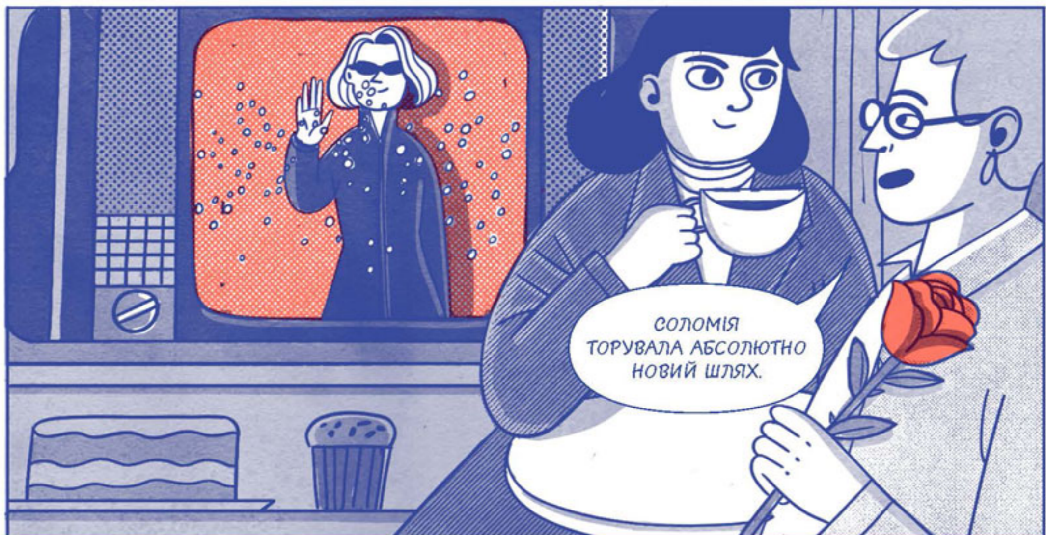
СОЛОМІЯ ТОРУВАЛА АБСОЛЮТНО НОВИЙ ШЛЯХ.