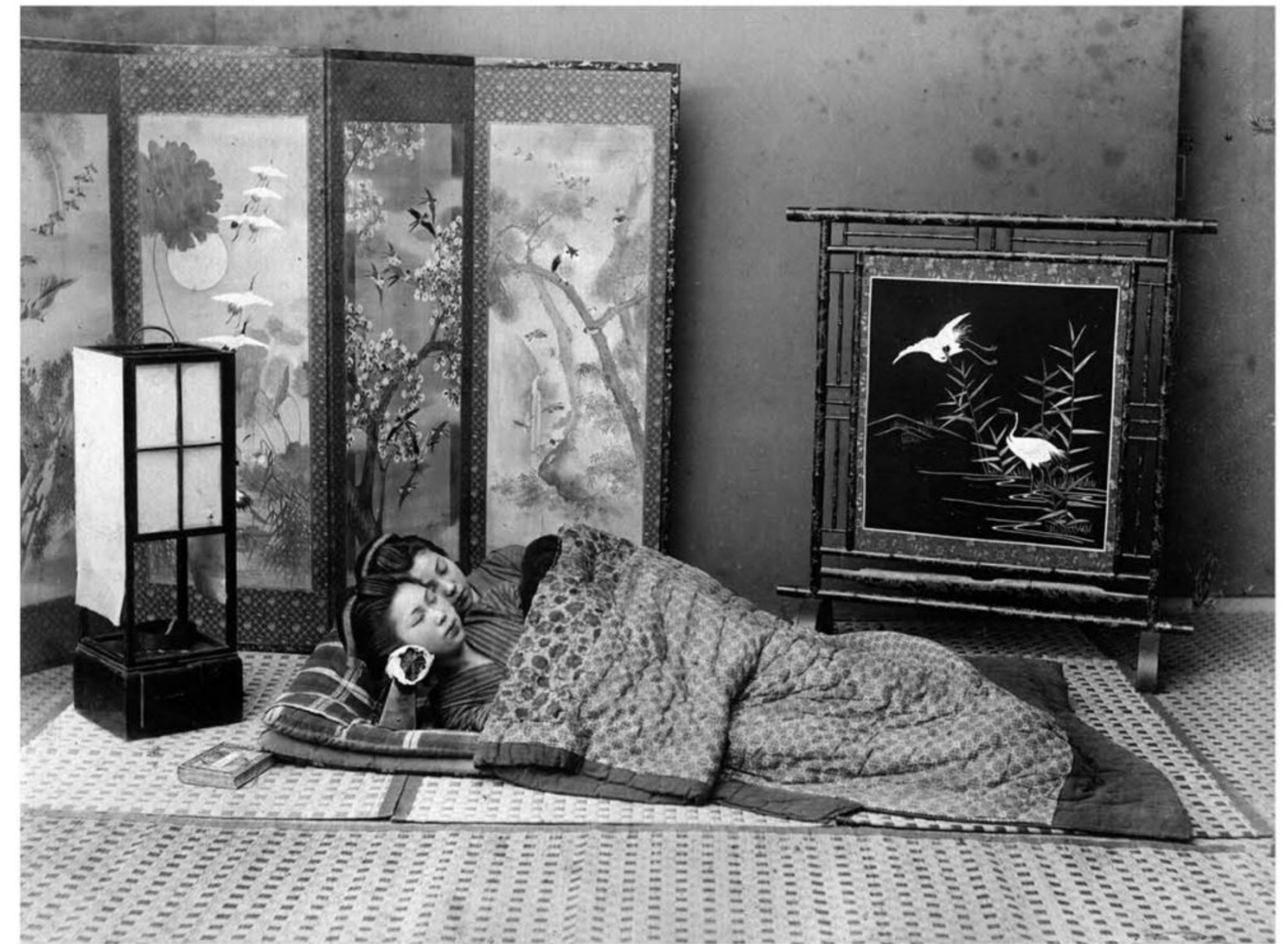
Дівчата в спальні. Дві японські дівчини сплять на маті, фото Кусакабі Кімбей. Chronicle/Alamy StockPhoto.

Сойн – це концепція взаємної близькості, яка не обмежується лише спільним сном на ліжках чи футонах. На фотографії Кімбей Кусакабе «Дівчата в спальні», датованій приблизно 1880 роком, дві японські дівчини, пов'язані або й не пов'язані родинним зв'язком, сплять на матах під гаптованою ковдрою. Біля ліжка лежить книжка, а навколо стоять розмальовані ширми. Дівчата лежать обличчям до камери, заплющивши очі і, вочевидь, відчують блаженний спокій у товаристві одна одної.