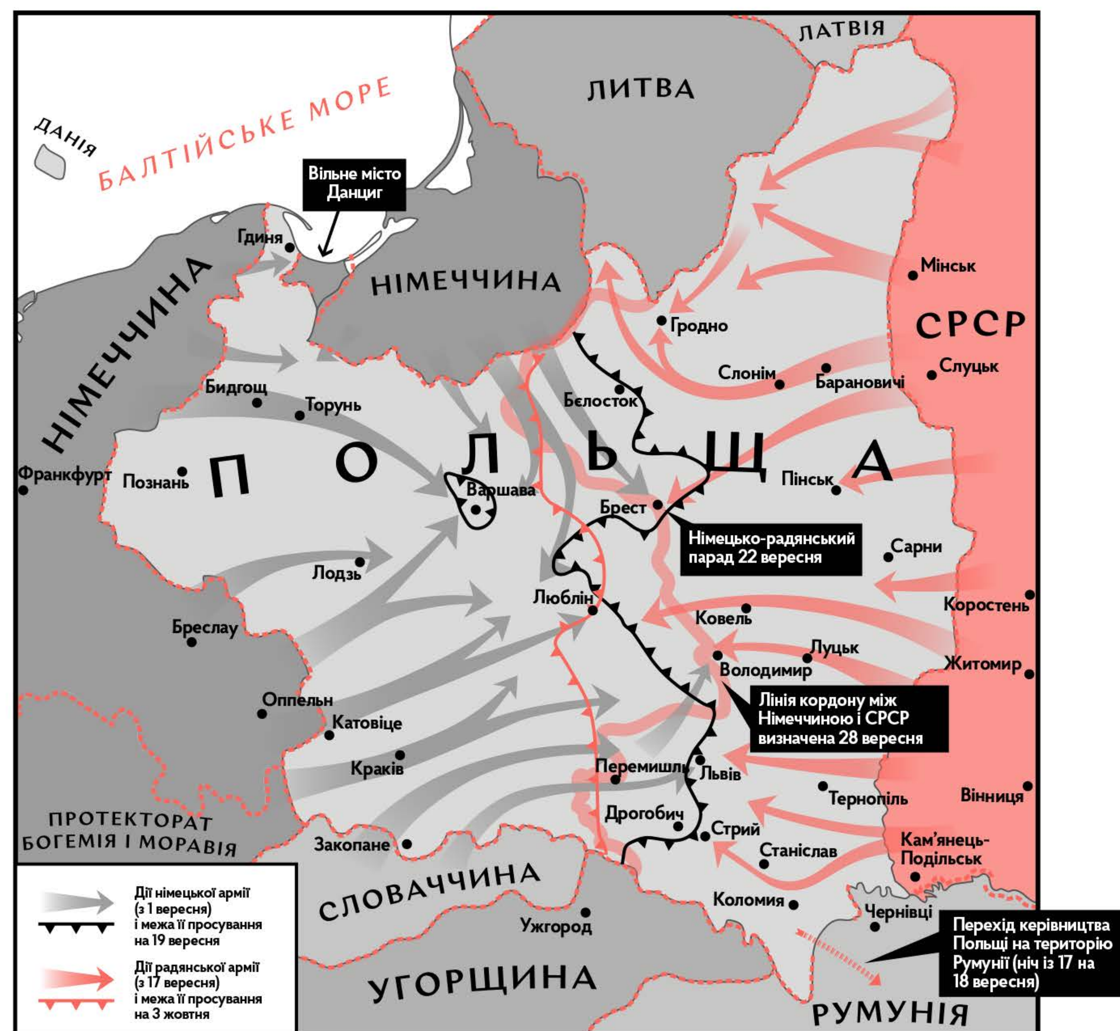
Спільні бойові дії німецької та радянської армій у 1939 році

Червона армія повністю зайняла Західну Білорусь і Західну Україну (польські «Креси Вихідні») та відповідно приєднала їх до Радянської Білорусі та Радянської України .