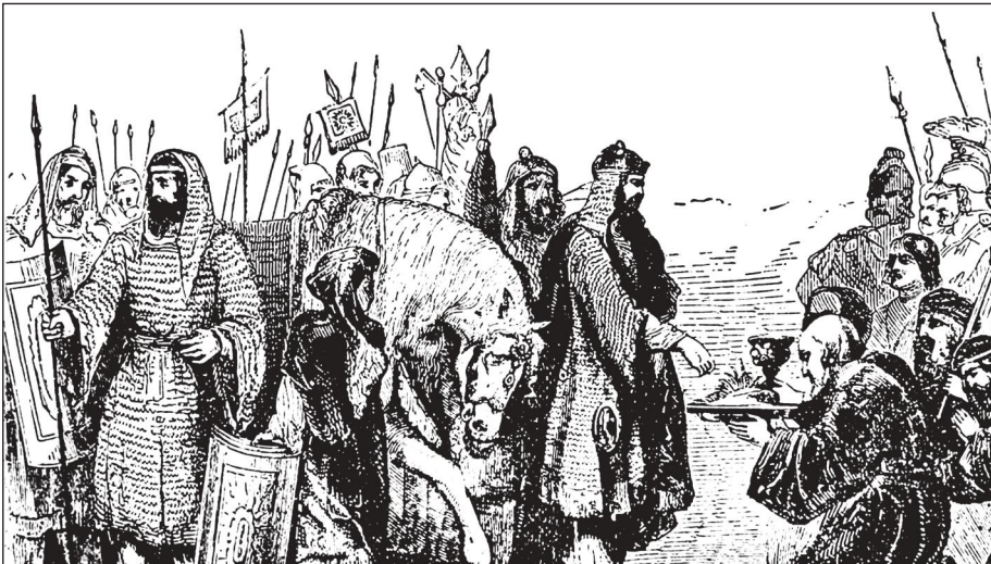
Афіняни передають «землю і воду» персам

Проте афінське посольство примудрилося припуститися ще однієї, набагато важчої помилки. Воно не лише пого-