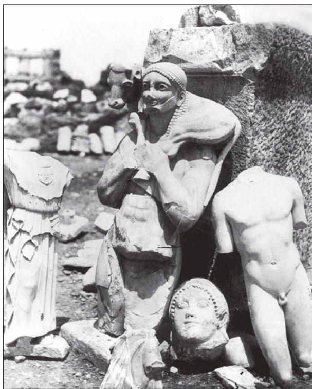
Скульптури із афінських храмів, зруйнованих після здобуття міста персами

Ворожі кораблі й справді невдовзі з'явилися на горизонті, однак попереджені містяни зустріли їх в озброєнні, просигналивши таки своїми щитами, що заскочити їх несподі-