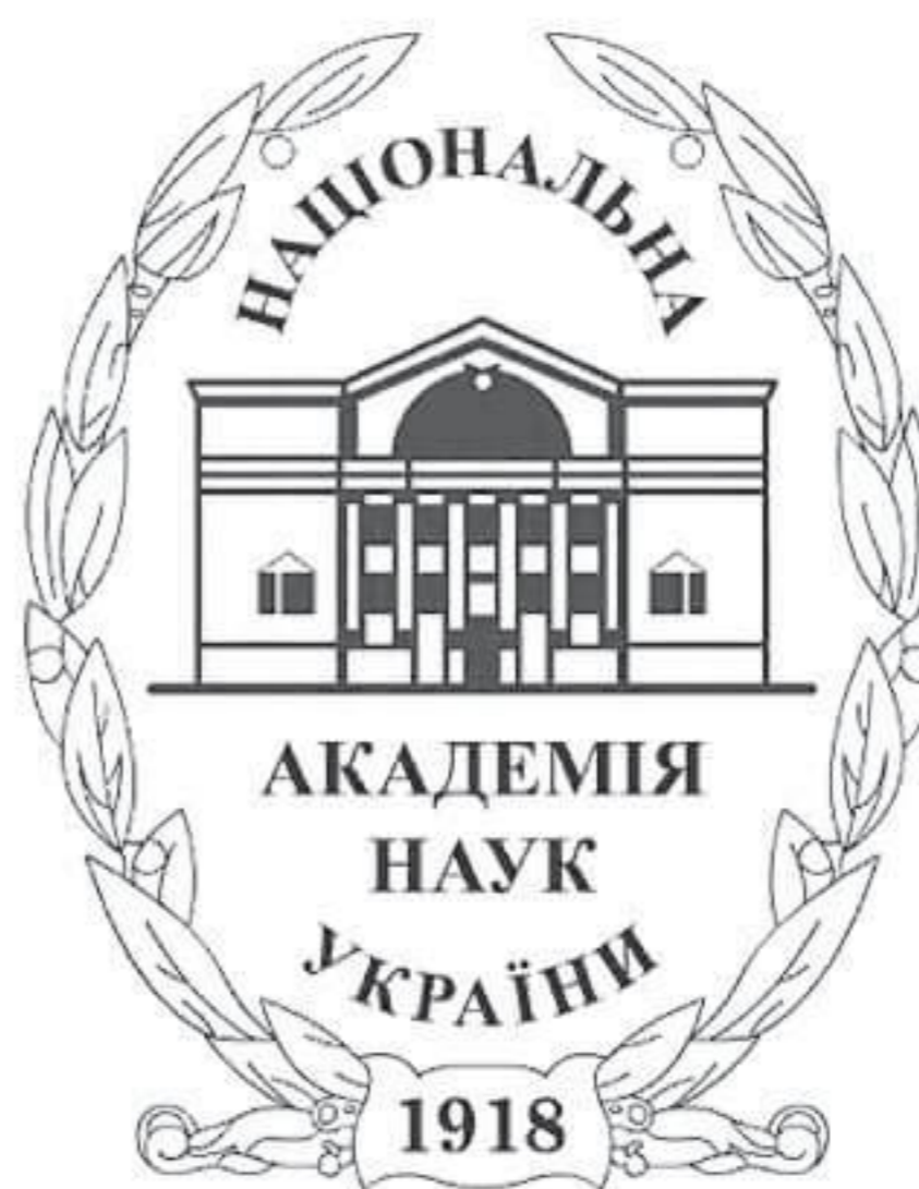
Логотип НАН України

— До цього ми повернемося. Знаємо, що колись казали, що в 1991 році кордон між цивілізо-