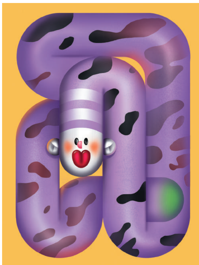
P. 19 Festive Mood, 2021 Digital