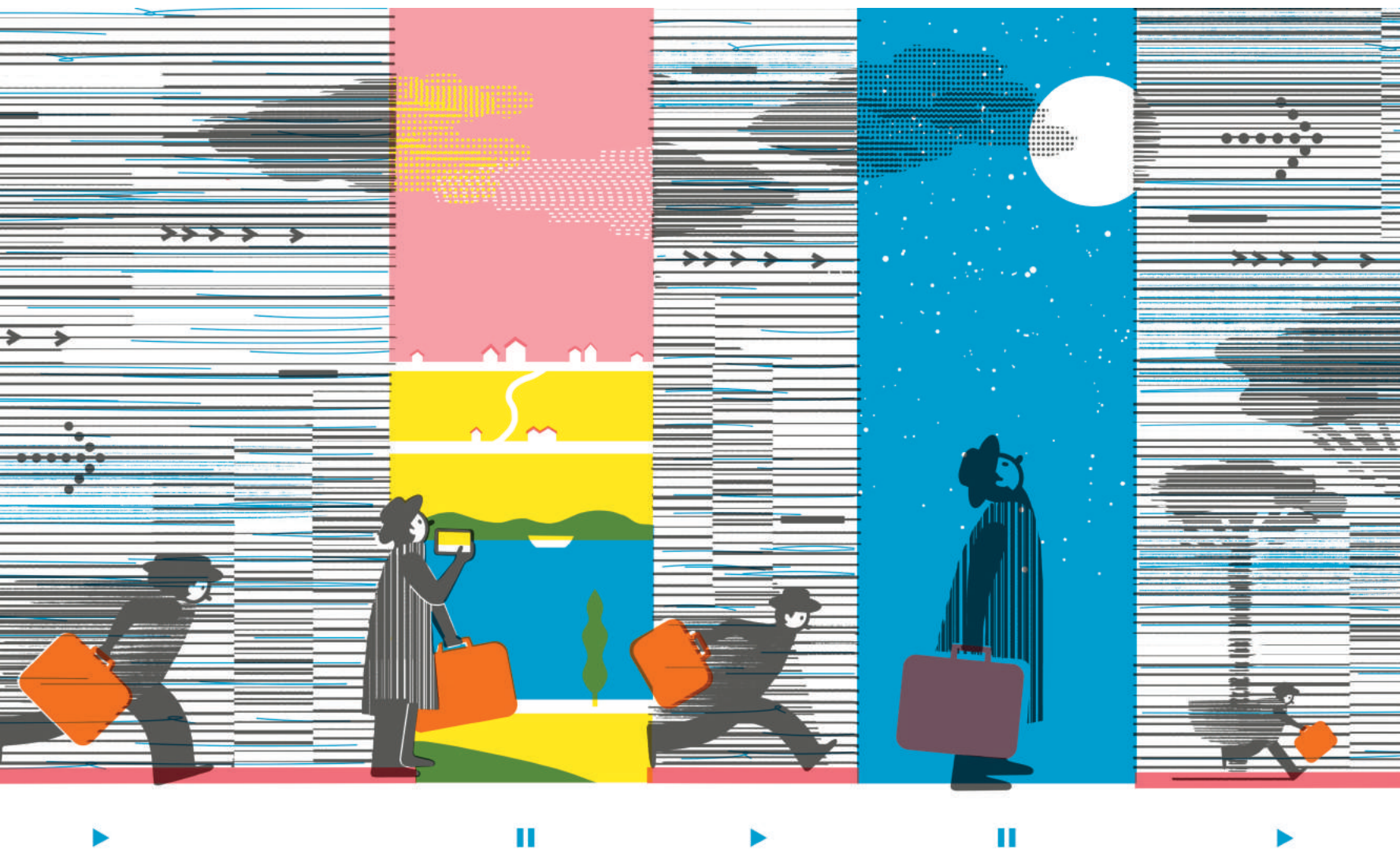
Slowing Down and Looking Around, an illustration from the book, On the Move, 2020 Romana Romanyshyn, Andrii Lesiv, The Old Lion Publishing House Digital