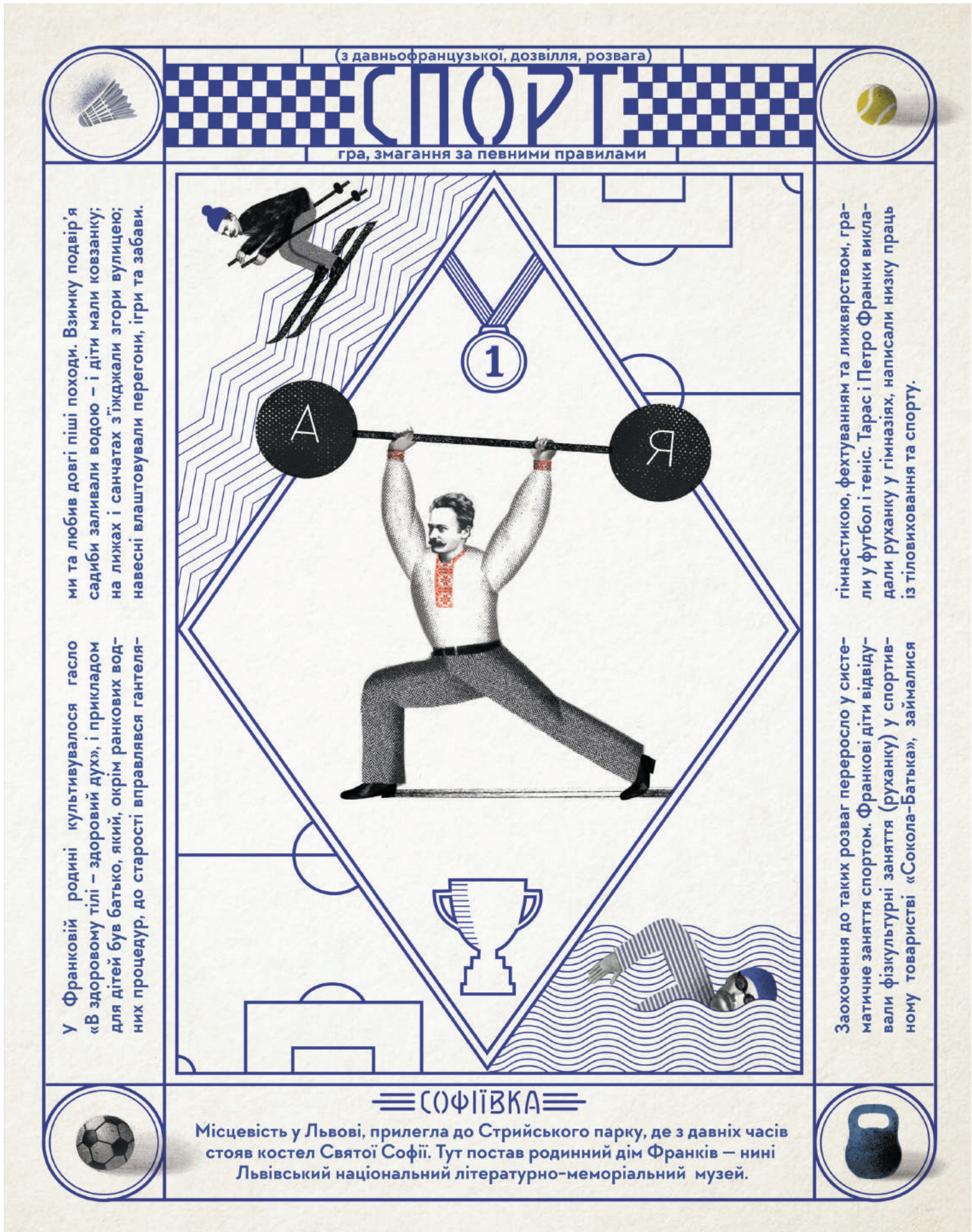
Letter S: Sport, Sofiivka, an illustration from the book, Franko from A to Z , 2016 Bohdan Tykholoz, Natalia Tykholoz, The Old Lion Publishing House Digital