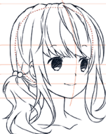
РАКУРС 3/4, ПРАВОРУЧ

У ракурсі 3/4 віддалений бік обличчя «сплющується», а отже, віддалене око має бути вужчим.