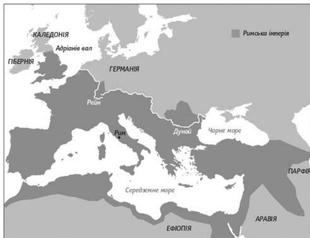
Межі Римської імперії близько II століття н. е.

Середземномор'я. Грецькі поселення існували на території нинішньої Туреччини, на узбережжі Північної Африки й навіть далеко на заході — в Іспанії, на півночі Італії та Франції. І саме в Італії римляни — на той час доволі відсталі мешканці невеличкого міста-держави із центром у Римі — вперше зустрілися з греками й почали в них учитися.