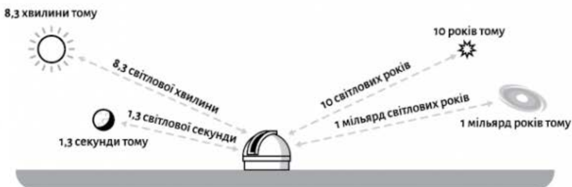
Рис. 1: Аберційний час (час, за який світло долає відстань). Ми інколи виражаємо відстань у світлових секундах, світлових хвилинах і світлових роках, тому що так зрозуміліше, скільки часу знадобилося світлу, щоб дійти до нас від об'єкта, і відповідно — наскільки далеко в минуле ми заглядаємо. (Усі ілюстрації в цій книжці будуть не в масштабі!)

Усе зводиться до факту, що світло проходить певну відстань за певний час. Швидкість його велика — десь 300 мільйонів метрів за секунду — але все ж воно не долає відстані в момент. Коли ви вмикаете ліхтарик, світло, що йде від нього, проходить десь 30 сантиметрів за наносекунду і, відбиваючись від того, на що ви світите, летить до вас із приблизно такою самою швидкістю. По суті, коли ви на щось дивитесь, то зображення, яке ви бачите — тобто світло, яке відбиває об'єкт і яке доходить до ваших очей, — уже трішки втрачає новизну. Людина, яка сидить в іншому куточку кафе, перебуває відносно вас на кілька наносекунд у минулому — це пояснює, чому в неї такий ностальгійний вираз обличчя й такий немодний одяг. Коли ви дивитесь на Місяць — ви бачите його версію трішки більш ніж секундної давності. А зірки на небі взагалі далеко в минулому, від кількох років до тисячоліть.