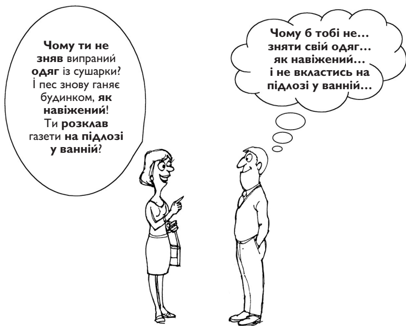
У чоловіків вибірковий слух

Чоловічий мозок однозадачний. Чоловіки можуть зосередитись лише на одній речі. Коли чоловік відкриває карту, він вимикає радіо. Якщо жінка розмовляє з ним, коли він їде по кільцевій розв'язці, він пропустить свій виїзд, а потім звинуватить у цьому її, бо вона розмовляла. Коли дзвонить телефон, він просить усіх замовкнути, щоб він міг відповісти. Деяким чоловікам – часто вони займають найвпливовіші посади – буває важко навіть одночасно ходити та жувати гумку.