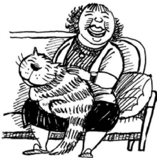
Муля виявився товстезним котищем

виходить, спорожнів, от він і просить, так би мовити, його заповнити.