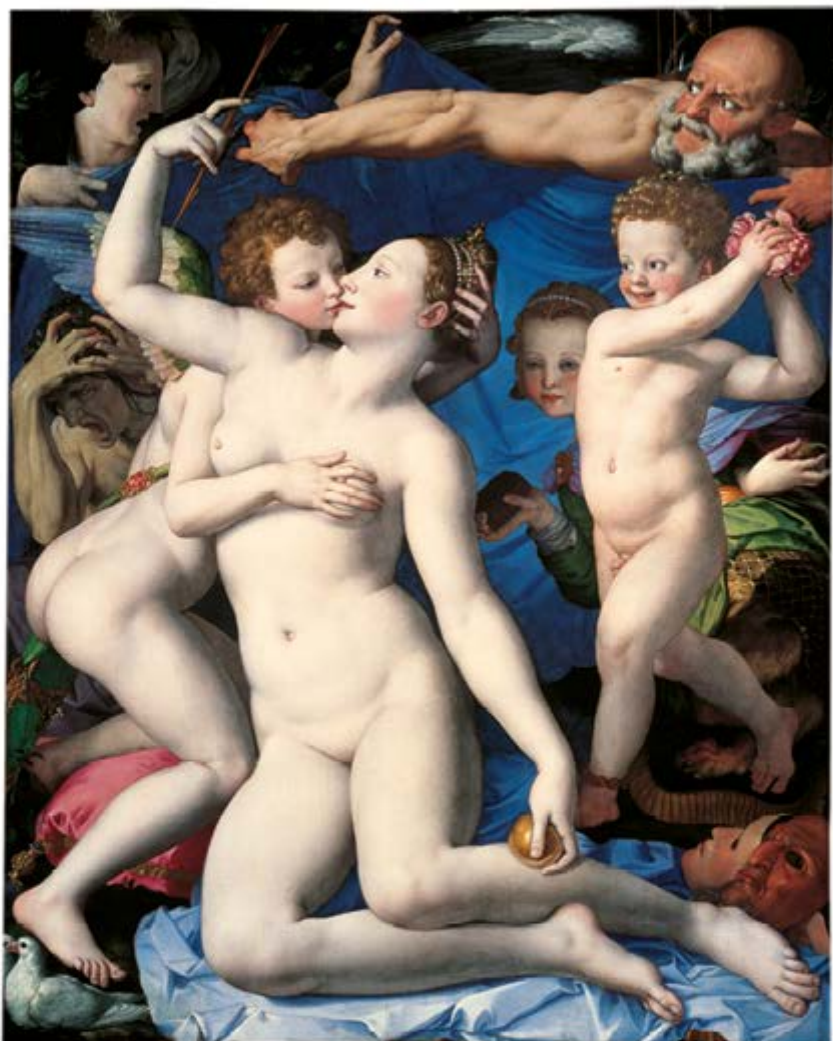
Аньоло Бронзіно «Венера, Амур і алегорія Ревнощів» Приблизно 1545 р. Полотно, олія, 146 x 116 см Національна галерея, Лондон

Цю складну алегоричну картину було створено і для повчання, і для розпалювання уяви культурної еліти.