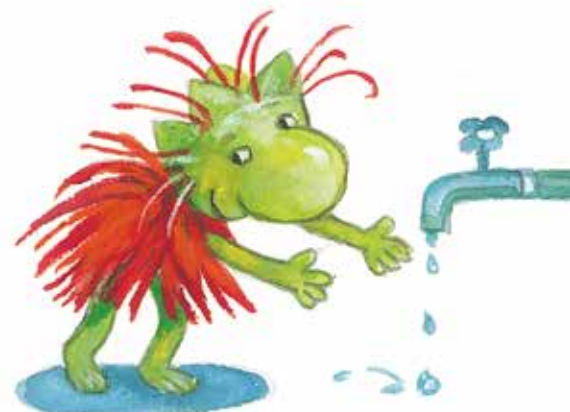
Мити руки не забувай!