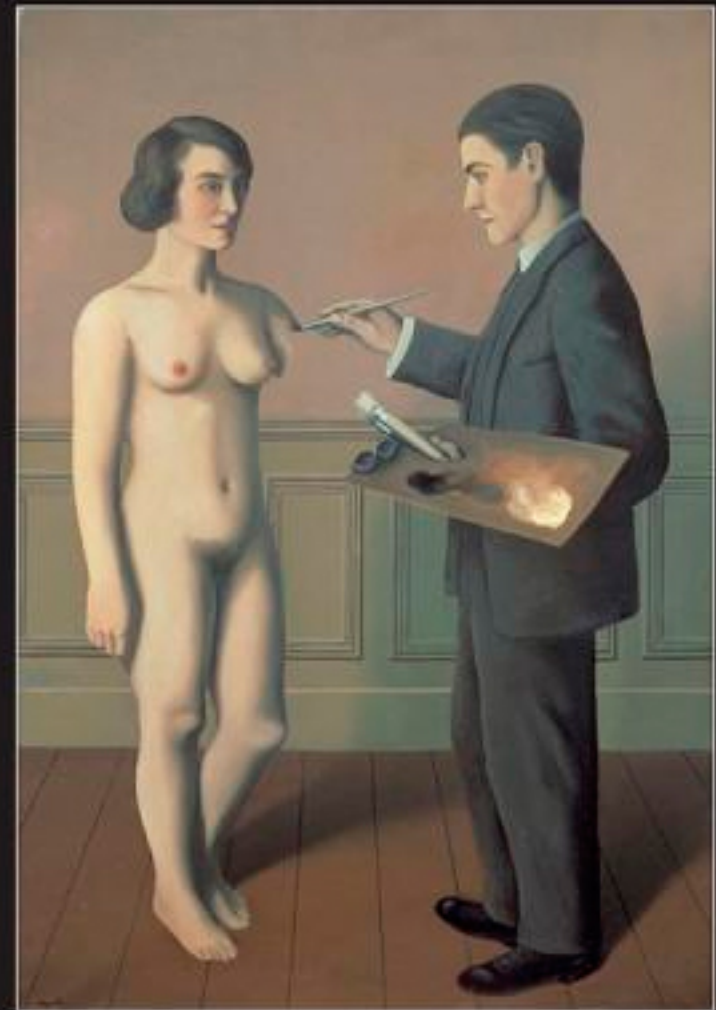
Сироба неможливого René Magritte, 1928 р.

Полотно, олія, 105 x 81 см Eau-forte by Anichin, Iproronto