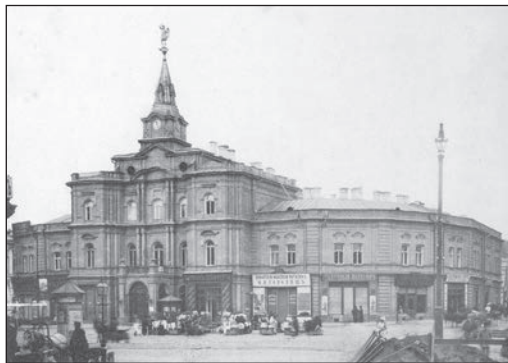
Будівля міської думи

перевагою для бізнесу та економіки міста. Додавали бонусів Києву як бажаному місцю проживання й розвинута міська інфраструктура (яка — ми побачимо далі — постійно розвивалася), наявність працівників (які приїздили тією самою залізницею або приходили пішки), місткий міський ринок (сформований тими самими мігрантами).