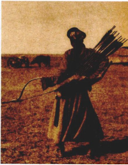
Озброєний луком монгол. Фотографія XIX століття

мішень не втраплять. Тож до виготовлення стріл монголи ставилися надзвичайно відповідально і брали в цій справі участь усі, навіть діти. Які днями нищпорили по степу, полюючи на птахів, або в пошуках пташиного пір'я. Яке йшло, звісно, не на перини. А на оперення смертоносних монгольських стріл.