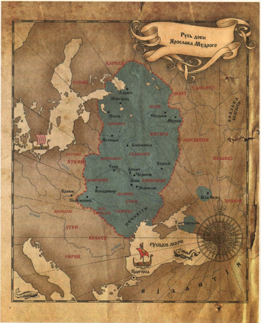
Україна-Русь в часи Ярослава Мудрого