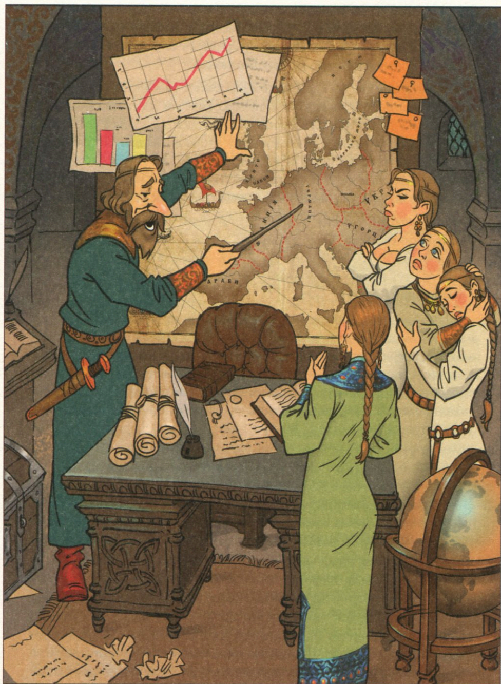
Шлюбна експансія великого князя Ярослава