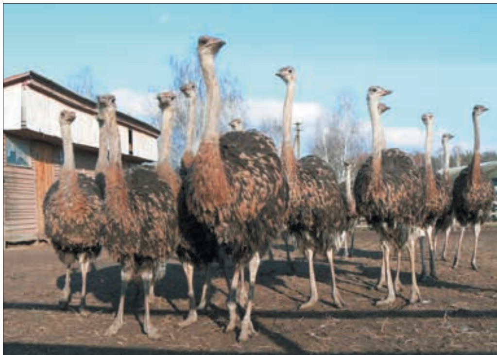
Ферма «Долина страусів»

Вісім років тому нові господарі звичайної птахоферми вирішили перетворити її на розважальний комплекс із рестора-