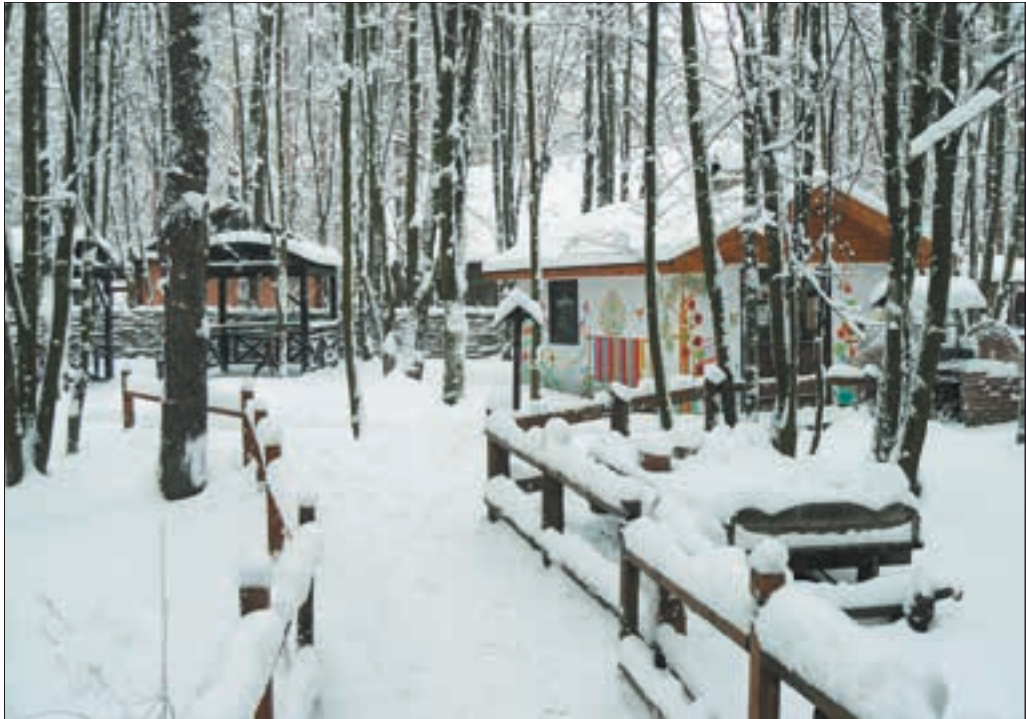
Етнографічний комплекс «Українське село»

До речі, в «Українському селі» вважають, що Масляна — це російська традиція: млинці, трійка, балалайка. А у нас це свято Колодія, завершальний зимовий цикл. Колода — символ зимового холоду, нудьги, застою та нерішучості. Її прив'язують мотузкою неодруженим па-