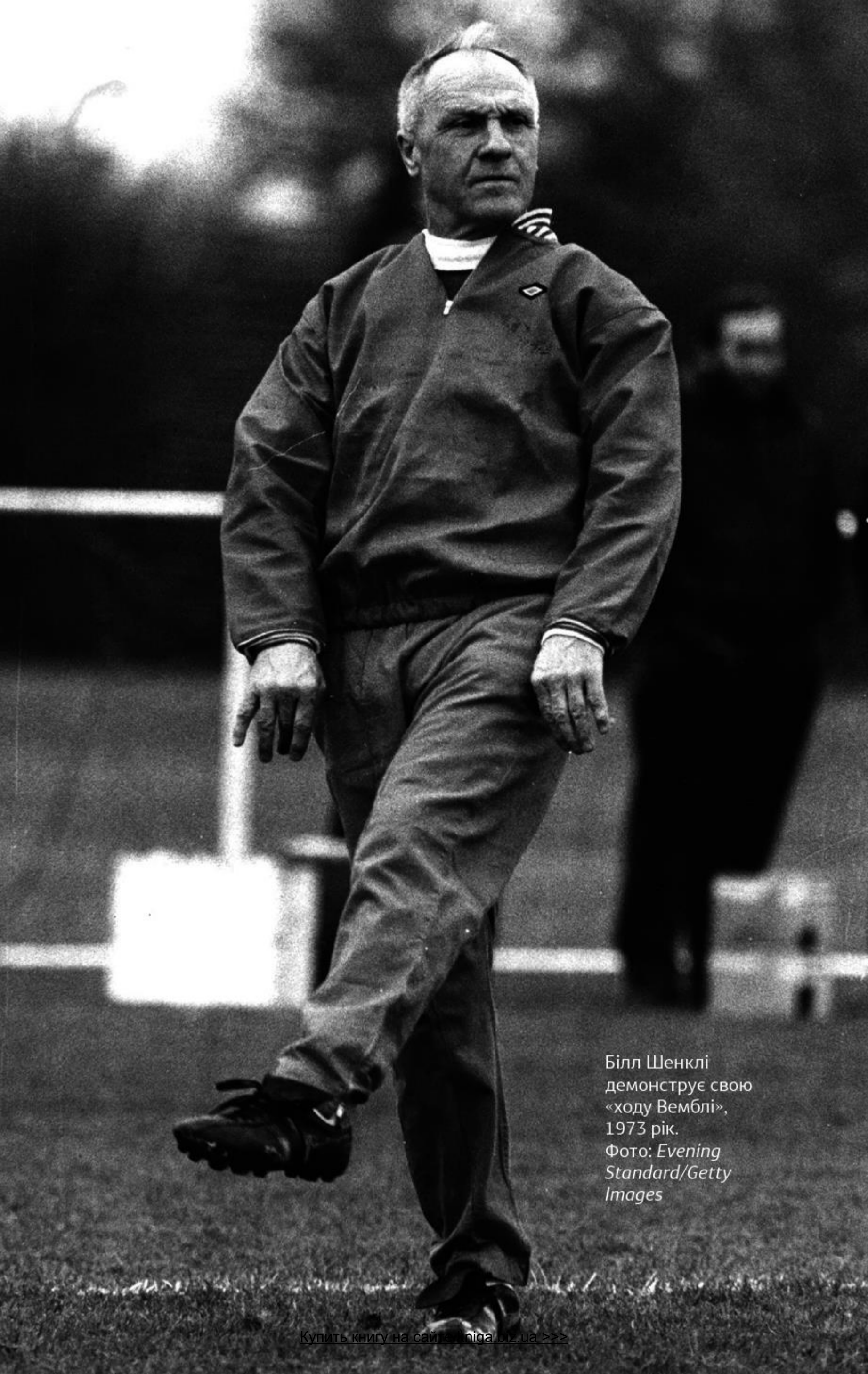
Білл Шенклі демонструє свою «ходу Вемблі», 1973 рік.