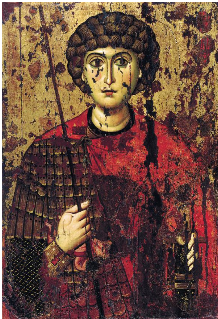
☞ Ікона святого Георгія XII століття Успенський собор Московського Кремля

По-друге, у часи Революції гідності, коли НХМУ опинився у буквальному сенсі «на лінії вогню», рельєфна ікона святого Георгія, де постать молодого воїна зі щитом уміщена в просторі «від землі до неба», була чи не найближчою до протистояння, в якому дилема (грецьке поняття!) залишалась тією ж: коритись неправедним наказам чи піти на жертвну смерть. Молоді воїни із саморобними щитами, для яких рядок класика: «Огонь запеклих не пече» – був зовсім не метафорою, зробили вибір, в якомусь сенсі такий же, як і святий Георгій. Не всі вони були християнами, не всі бували у музеї, стояли перед цією іконою, але також пішли на жертвну смерть. Тому їх пізніше й назвали «Небесною Сотнею».