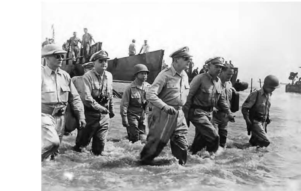
Генерал Дуглас Макартур повертається на Філіппіни.