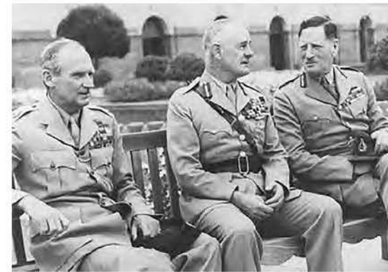
Троє найбільших британських польових командирів, які воювали в критично важливій «Війні в пустелі» проти німецьких та італійських військ: фельдмаршал сер Арчібалд Вейвелл (посередині), віце-король Індії, фельдмаршал віконт Монтгомері Аламейнський (зліва) і фельдмаршал сер Клод Окінлек, головнокомандувач Індійської армії. 17 червня 1946 року.