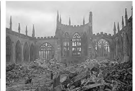
Руїни собору в Ковентрі через два дні після того, як літаки Люфтваффе бомбардували місто в ніч 14 листопада 1940 року.