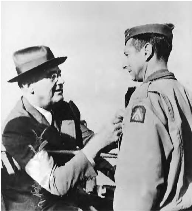
Генерал Марк Кларк отримує нагороду — орден «За видатні заслуги» — з рук президента Рузвельта в Італії, грудень 1943 року.