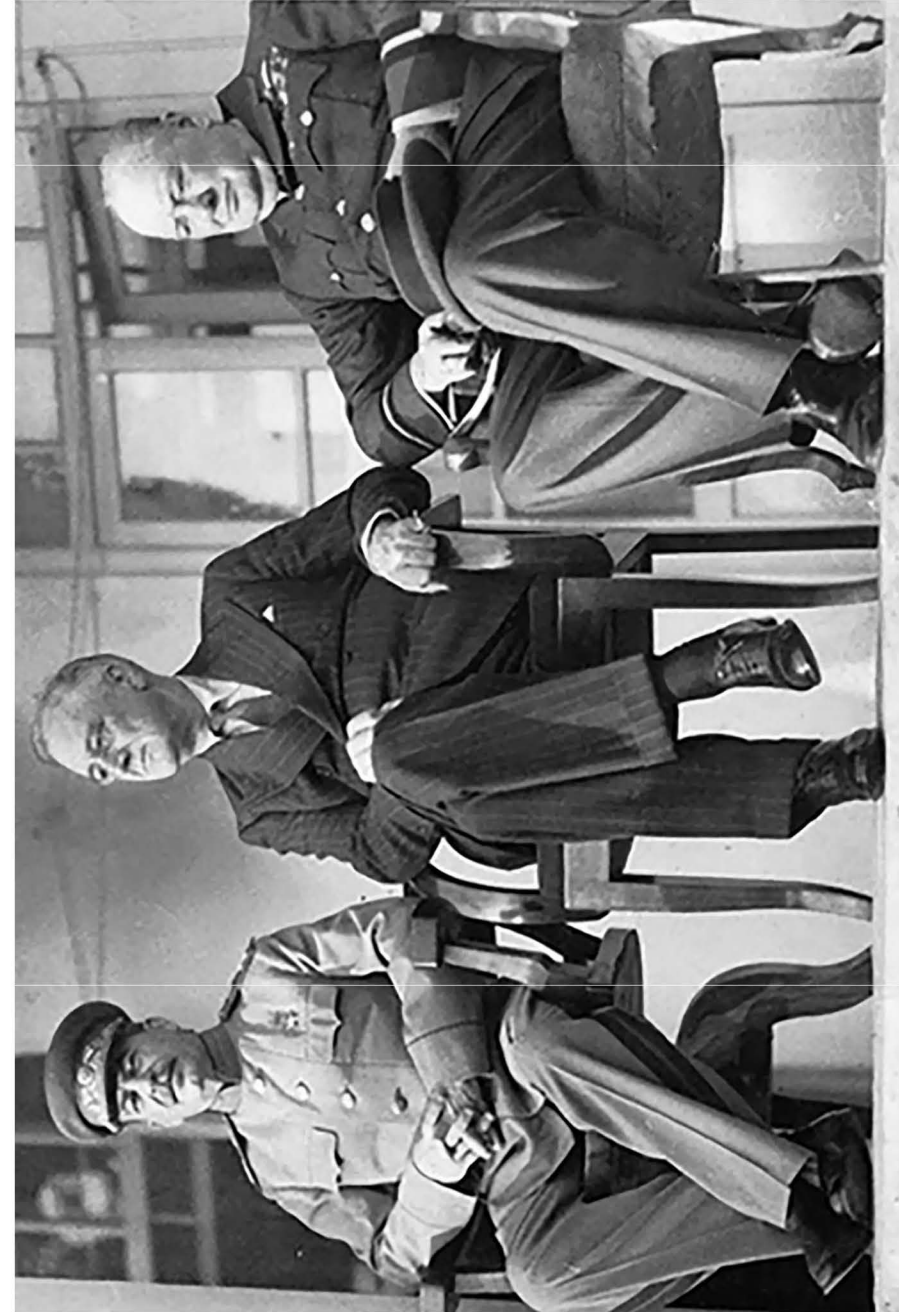
Лідери «Великої трійки» на Тегеранській конференції 1943 року. Зліва направо: радянський маршал Йосиф Сталін, американський президент Франклін Д. Рузвельт і британський прем'єр-міністр Вінстон Черчилль.