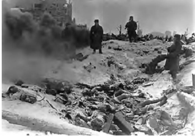
Мертві тіла у Сталінграді. 1943 рік.