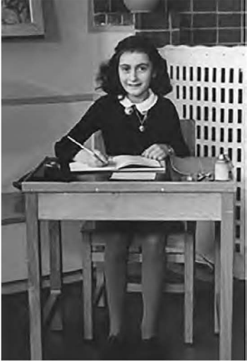
Анна Франк у школі у віці одинадцяти років. Стала жертвою переслідувань нацистів у війні Гітлера проти жінок і дітей. (Вікіпедія. Веб-сайт про Будинок-музей Анни Франк, Амстердам)