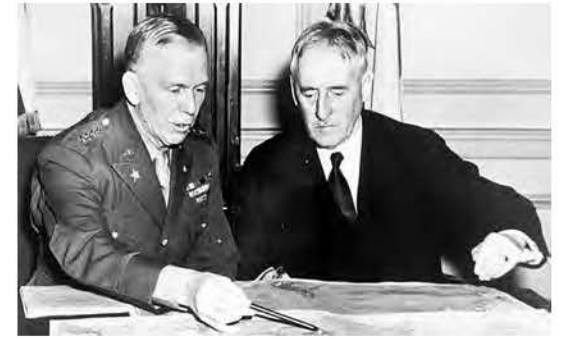
Генерал Джордж Маршалл з американським військовим секретарем Генрі Стімсоном.