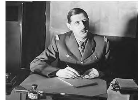
Лідер французького спротиву і командувач Вільних французьких сил генерал Шарль де Голль, який став президентом Франції.