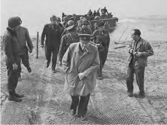
Британський прем'єр-міністр Вінстон Черчилль на Рейні у военний час, 25 березня 1945 року, разом з генералами Аланом Бруком та Монтгомері й кількома американськими генералами.