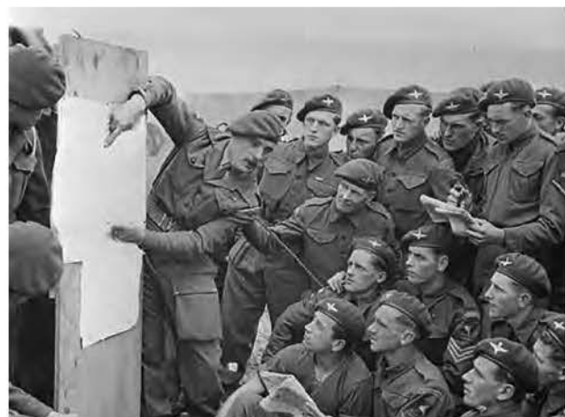
Безпосередньо перед Днем Д. 6-та повітряно-десантна дивізія британської армії на інструктажі в Англії щодо висадки в Нормандії. 4–5 червня 1944 року.

Генерал Ейзенгауер підбадьорює американських парашутистів американської 101-ї повітряно-десантної дивізії в Британії перед тим, як вони сядуть у літаки для вторгнення в Нормандію в День Д, 5 червня 1944 року.