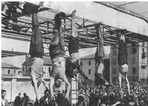
Мертві тіла колишнього італійського диктатора Беніто Муссоліні та його коханки, публічно повішені догори ногами в Мілані після того, як їх розстріляли з кулеметів антифашистські партизани.