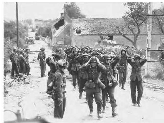
Німецькі сили здаються в Сен-Ламбер-сюр-Діві. 21 серпня 1944 року.

Зліва направо: генерали Паттон, Бредлі та Монтомери жартують у Нормандії, 7 липня 1944 року, штаб 21-ї армії.