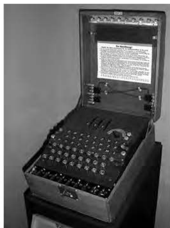
Британська машина «Еніґма», яку використовували для дешифрування німецьких військових і морських кодів.