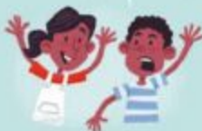
Молодші сестричка і братик