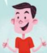
Друзі на Facebook