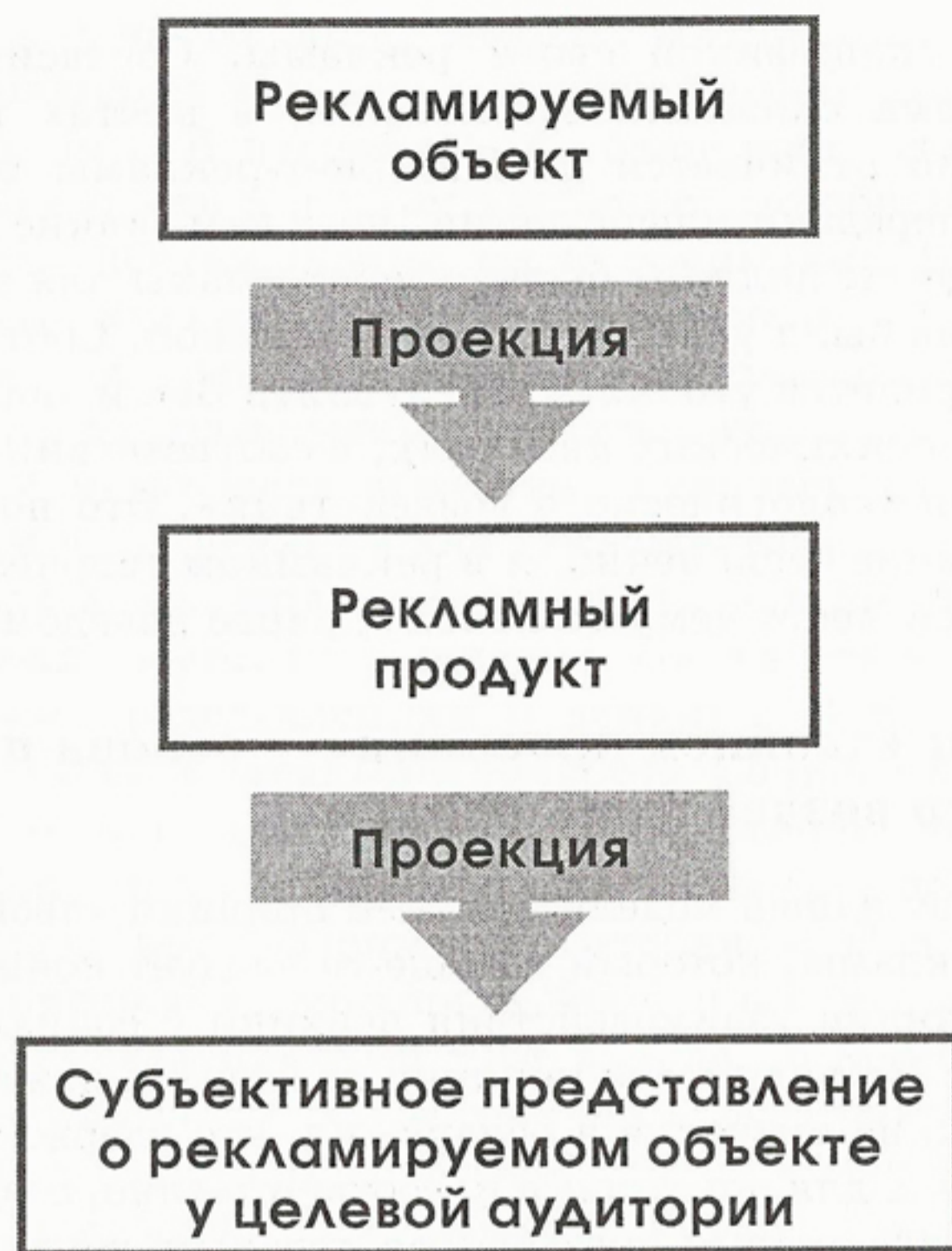
Рисунок 1. «Двойная проекция» рекламы – основа воздействия на целевую аудиторию.

projectio – выбрасывание вперед, и в строгом смысле означает «отображение точек, фигур, векторов пространства любой размерности на его подпространство любой размерности». По определению, подпространство всегда меньше и проще всего пространства. Иными словами, проекция – это всегда упрощение первоначального объекта – его редукция. Очевидный пример – это фотография: проекция трехмерного пространства на плоскость – пространство двумерное.